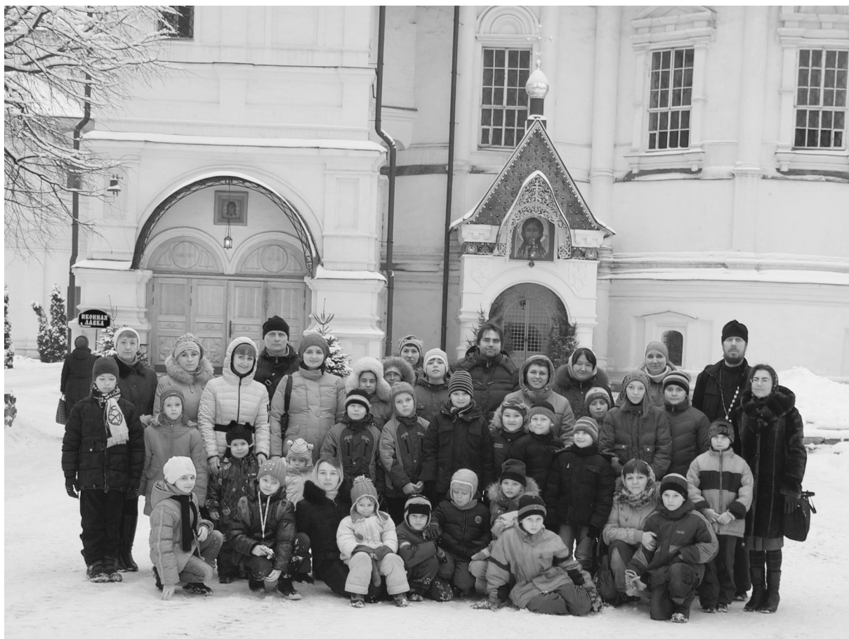
Воскресная школа у входа в усыпальницу бояр Романовых в Новоспасском монастыре

Очень было приятно после праздника узнать, что у наших представлений есть постоянные зрители. Оказалось, что некоторые из них были на всех праздниках, и поэтому недоумевали, почему же в этом году наши дети не спели песню «про ослика». Действительно, все наши рождественские представления не обходились без этой трогательной песни: « В пещере ослик кушает овес, в яслях лежит Христос...». Споем, обязательно споем в следующее Рож-