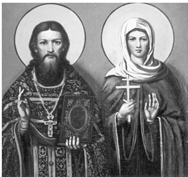
Святые священномученик Тихон и исповедница Хиония