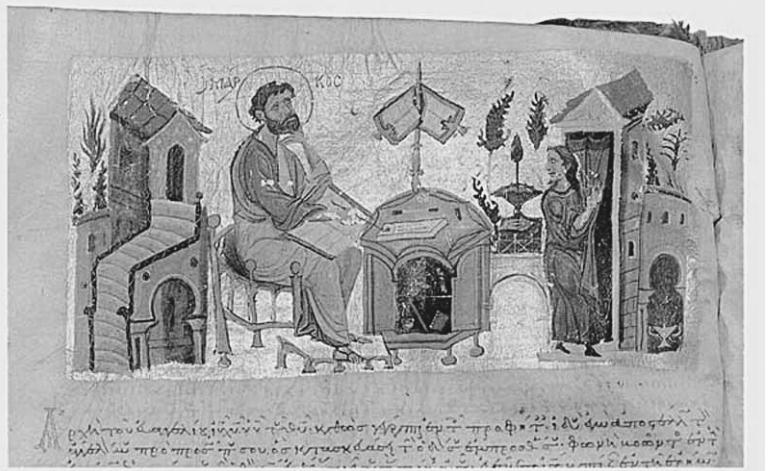
Святитель Андрей Критский. Миниатюра XII века.

В свое последнее посещение столицы святой Андрей простился со всеми, потому что почувствовал