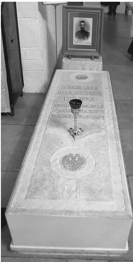
Могила великого князя Сергея Александровича Романова

В усыпальнице Романовых похоронена инокиня Досифея, насельница Иоановского женского монастыря. Немногим и сейчас известно, а уж тогда, в XVIII веке, и подавно скрывалось, что затворница и прозорливица Досифея - это дочь императрицы Елизаветы и Алексея Разумовского, имевшая в миру титул княжны Таракановой. К сожалению, ее благочестивая жизнь известна гораздо меньше, чем история мнимой княж-