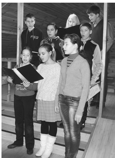
Разучивали рождественские песнопения и колядки и репетировали спектакли