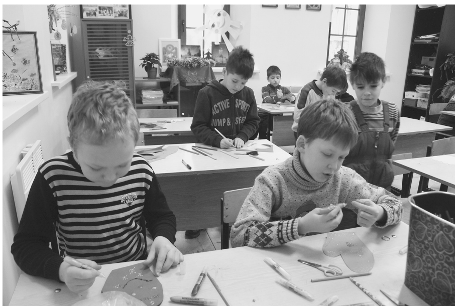
Готовили подарочные открытки для любимых преподавателей и стареньких дубовчан