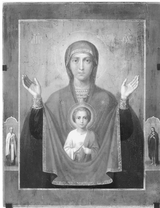
Абалацкая икона Божией Матери

(Надпись на открытке от Государыни Императрицы Александры Феодоровны П.А. Жильяру).