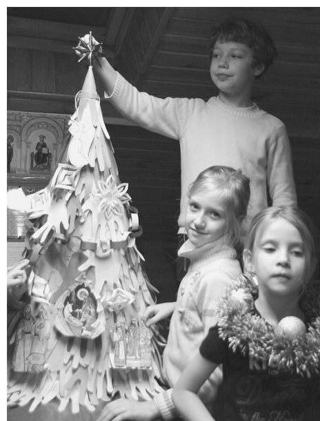
Сделали из бумажных ладошек «Рождественскую елочку»