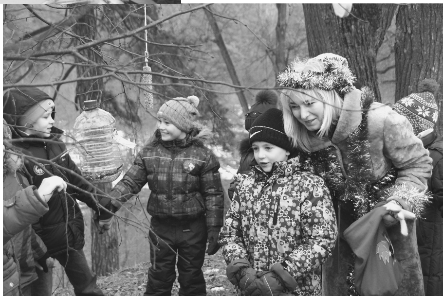
Смастерили кормушки для птичек и устроили для пернатых друзей «птичью елку». Теперь они дождутся весны и вместе с нами встретят праздник Благовещения и Пасху!