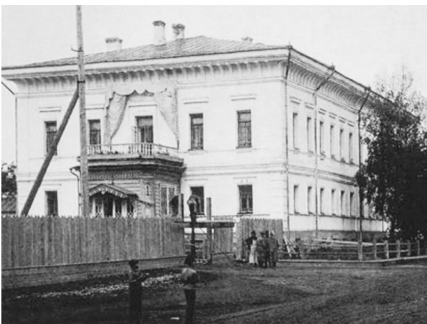
Губернаторский дом в Тобольске, в котором содержалась Царская семья

Светочи Ангельских слез Льются, о правде скорбя; Кроткий Младенец Христос Сам охраняет Тебя!» 1917