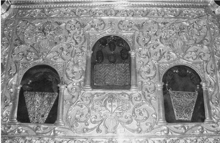
Дары Волхвов из монастыря св. Павла на Афоне

В 400 г. император Аркадий перенёс Дары в Константинополь в Собор Святой Софии. На протяжении тысячи лет Дары волхвов были одной из главнейшей святынь Византии.