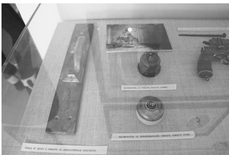
Подлинные вещи из дома Ипатьева в Екатеринбурге

Статью подготовила Т.А.Грицышина по материалам книги «Письма святых Царственных мучеников из заточения»