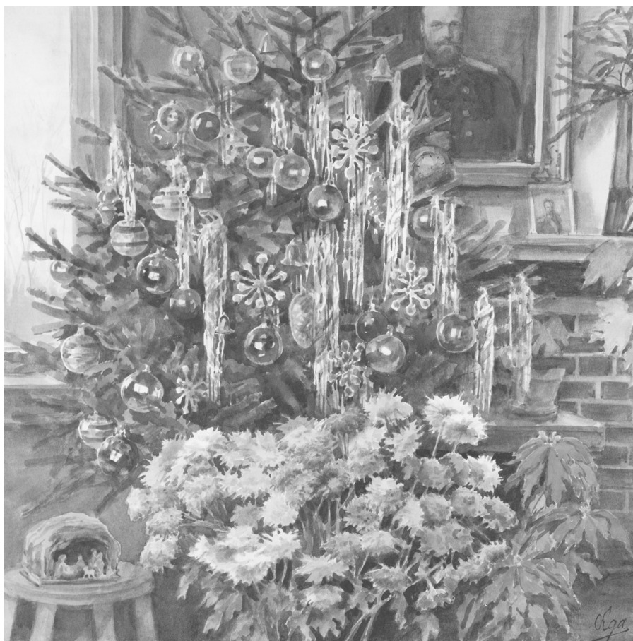
Рождество Христово. 1950 г. Акварель Великой Княгини Ольги Александровны, младшей сестры Царя-мученика Николая

Примечание. 3 (16) января 1918 года Солдатский комитет Отряда Особого Назначения, который нес караульную службу в бывшем губернаторском доме, где содержалась под стражей Царская Семья,