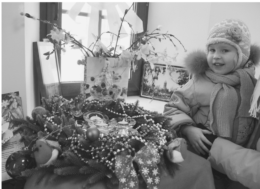
На занятиях по церковной флористике сделали рождественские композиции, веночки и гирлянды для украшения храма и воскресной школы