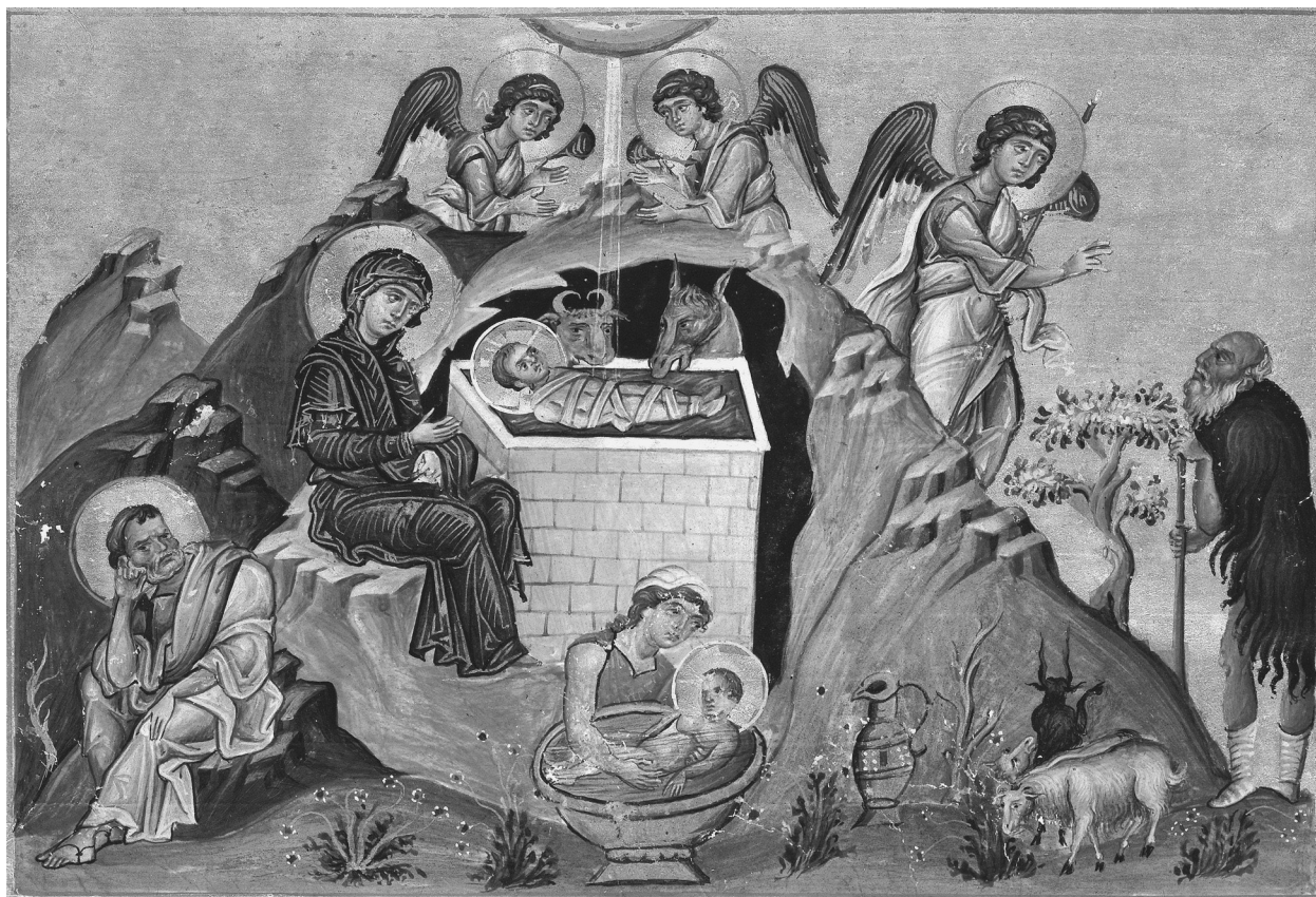
Рождество Христово. Миниатюра из Миналогия императора Василия II «Болгаробойца». Конец X века

Слава в вышних Богу, и на земле мир, в человеках благоволение!