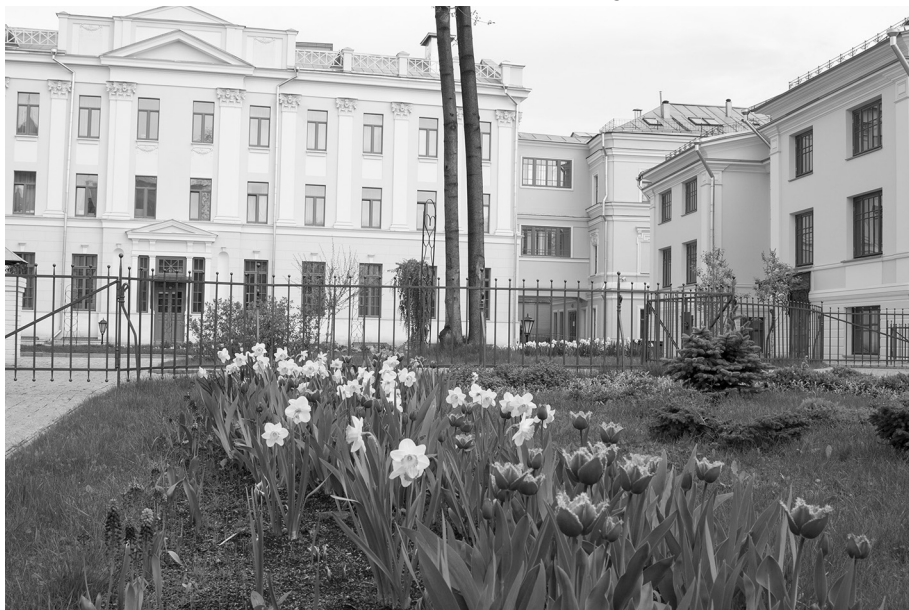
Современный вид зданий сестринского корпуса, аптеки, амбулатории и больницы

Кроме больницы, амбулатории и аптеки, в обители были другие социальные учреждения. В доме священника располагалась воскресная школа, где в 1913 г. обучались 75 девушек и женщин, работавших на фабриках. Там же находилась общественная библиотека (1590 томов религиозно-нравственной, светской и детской литературы). Со временем были выкуплены несколько зданий рядом с обителью, в которых разместились столовая для бедных (в 1913 г. в ней ежедневно отпускалось более 300 обедов по 5 копеек), общежитие («дешевые квартиры») для работающих в городе малообеспеченных женщин, ютившихся до того в «коечно-каморочных» сырых квартирах на окраинах.