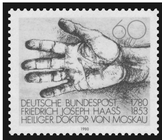
Марка, выпущенная в Германии к 200-летию доктора Гааза

Из рассказов лично знавших Гааза москвичей известно, что, когда какая-нибудь из дряхлых кляч, возивших его старую безобразную пролетку, которую он ни за что не хотел менять на новую карету, оказывалась совсем негодной для своей службы и оставалась спокойно доживать свой век, он отправлялся на конную площадь, где непременно покупал одну из лошадей, выведенных на убой татарам, - и спасенное от ножа животное продолжало жить, неторопливо перебирая разбитыми ногами у истертого дышла известной всей Москве пролетки. Концы по Москве приходилось делать большие, и проголодавшийся Гааз иногда останавливался у какой-нибудь пекарни и покупал четыре калача - один для