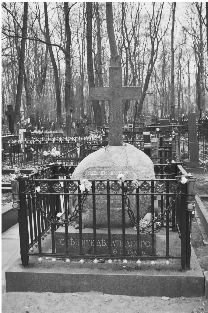
Могила доктора Гааза на Немецком кладбище в Москве

Своеобразный в одежде (фрак, жабо, короткие панталоны, черные чулки и башмаки с пряжками), в образе жизни и в языке — живом, образном и страстном, — Гааз жил в полном одиночестве, весь преданный делу благотворения, не отступая ни пред