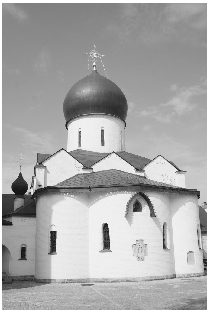
Покровский храм Марфо-Мариинской обители

Дело не для слабых В сестры принимались только физически здоровые девицы и вдовы православного вероисповедания от 21 до 40 лет (социальное служение требовало больших физических усилий). Главным делом сестер было посещение бедняков «на местах». Все они, включая настоятельницу, регулярно обходили ночлежные дома знаменитого Химрова рынка, делая перевязки больным, препровождая детей в приюты, находя места безработным.