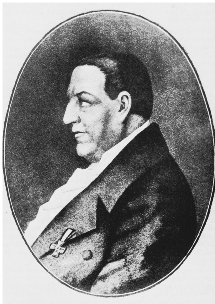
Единственный прижизненный портрет доктора Гааза

здания: колодки, приковывание к тяжелым стульям, ошейники со спицами, мешавшими ложиться и т.п. Препровождение ссыльных в Сибирь совершалось на железном пруте, продетом сквозь наручники скованных попарно арестантов. Подобранные случайно, без соображения с ростом, силами, здоровьем и родом вины, ссыльные, от 8 до 12 человек на каждом пруте, двигались между этапными пунктами, с проклятиями