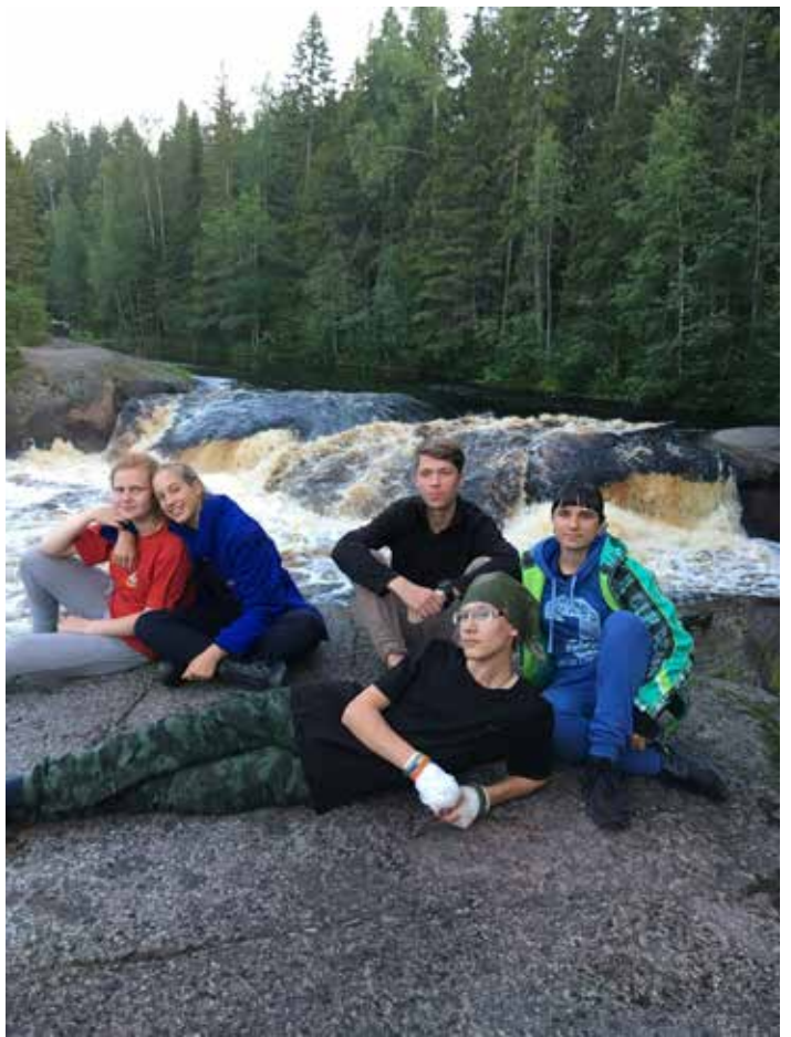
На карельских порогах. Река Уксунйоки.

Второй день был посвящён паломничеству на Смоленское кладбище, там помолились в часовне святой блаженной Ксении Петербургской. Потом смело ринулись осваивать мировую культуру в Эрмитаже и Мариинском театре. В самой знаменитой картинной галерее мы сосредоточились на изучении творчества импрессионистов, даже «Чёрный квадрат» разыскали. Вечером успели на оперу Ш. Гуно «Фауст» в Мариинском театре. В перерывах культурной программы гуляли по улицам и проспектам Санкт-Петербурга.