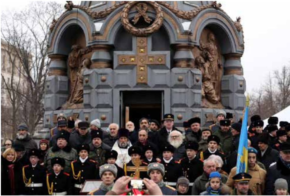
Участники торжественного мероприятия 10 декабря 2017 г. возле часовни-памятника героям Плевны

и совершается поминовение русских воинов, павших в войне за освобождение славянских народов.