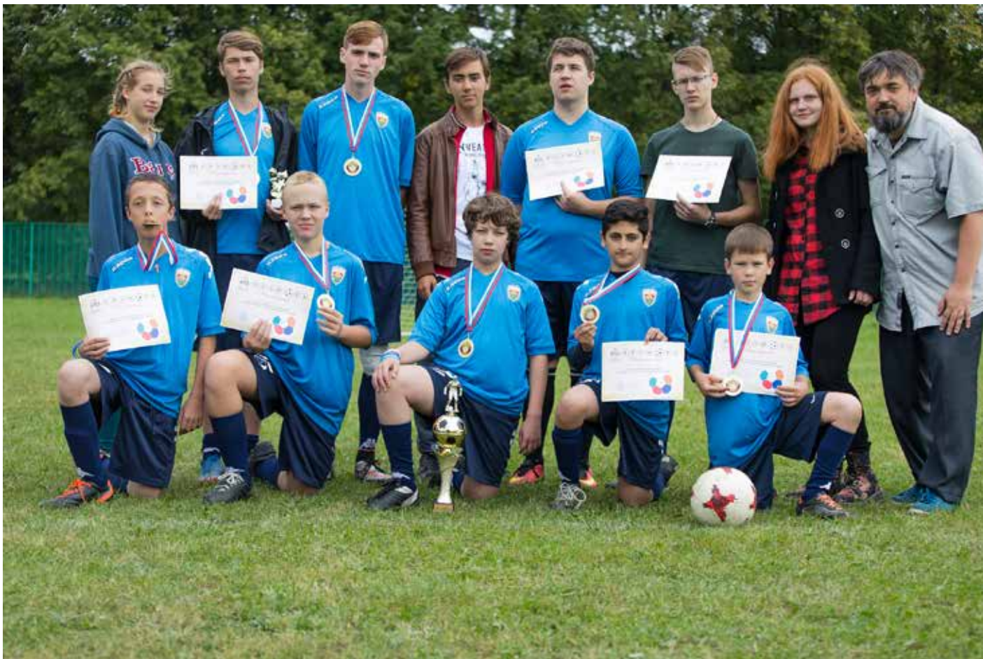
Футбольная команда воскресной школы «Знамение» с победным кубком в Давидовой Пустыне.

храма пос. Дубровицы г. Подольска. В финале турнира команда «Знамение» одержала победу и была награждена главным кубком.