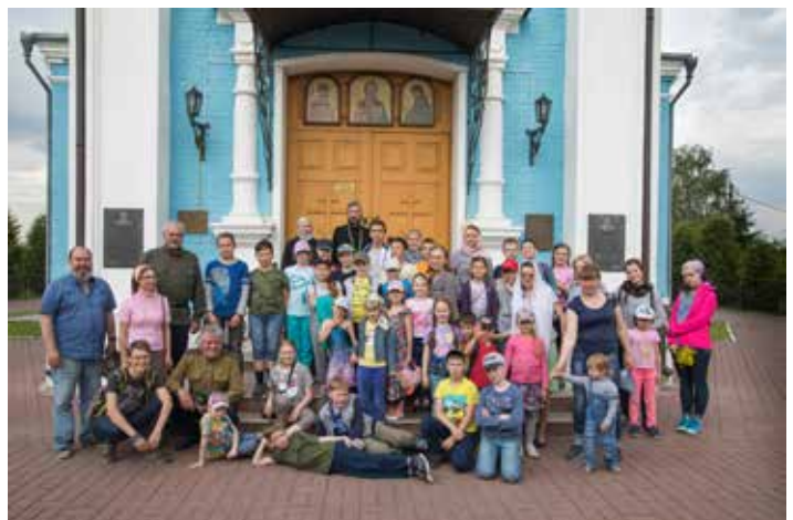
Воскресная школа в Покровской храме села Покров

Свой театральный сезон молодежная студия нашей воскресной школы «Пилигримы» завершила 28 мая спектаклем по сказке Дж. Макдональда «Невесомая