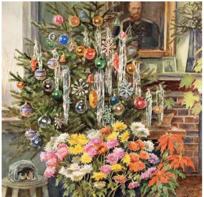
Рождество Христово. 1950 г. Акварель Великой Княгини Ольги Александровны, младшей сестры Царя-мученика Николая