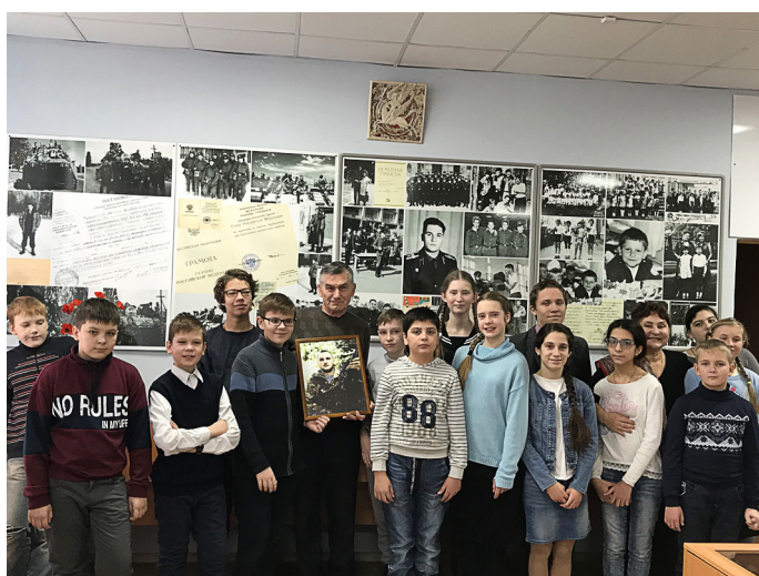
В музее боевой славы