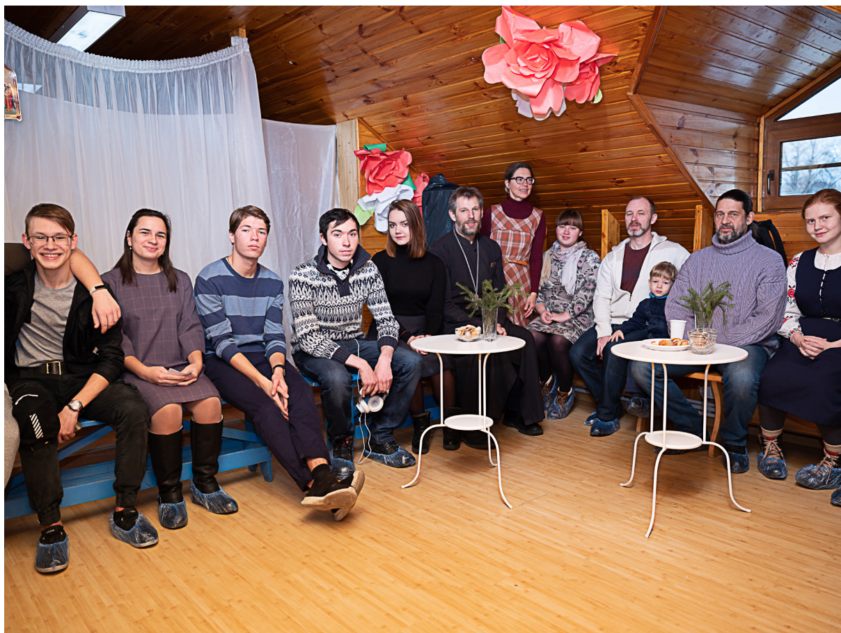
Беседа «Мой выбор - моя ответственность»

субботники в монастырях, творческие конкурсы и другие.