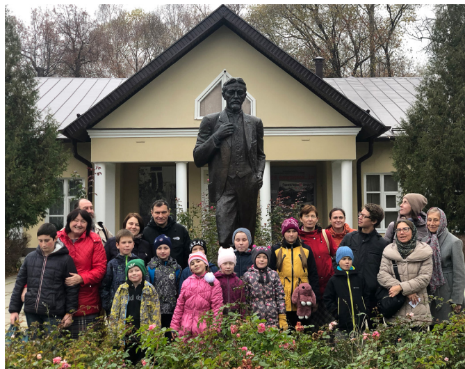
Воскресная школа в Мелихово

21 октября состоялась поездка группы детей