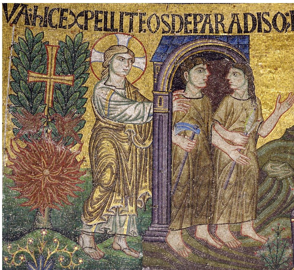
Изгнание Адама и Евы из рая Древняя христианская мозаика