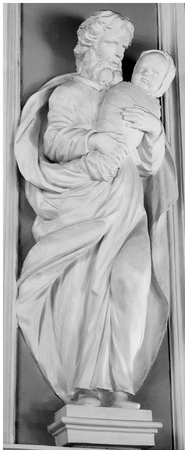
Дубровицы. Праведный Симеон Богоприимец

пророчица. И после этого бывает Литургия, и затем бывает отпуст».