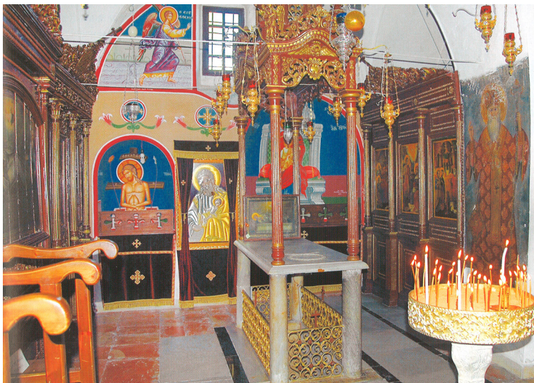
Гробница праведного Симеона в монастыре Катамон

По преданию святой старец скончался на 360 году, узрев очами телесными и духовными Христа Господня в сорокадневном Младенце Иисусе. О том, где он был погребён в Иерусалиме, древних источников не сохранилось. Есть сведения, что при императоре Иустине (565 - 578 гг.) его мощи были перенесены в Кон-