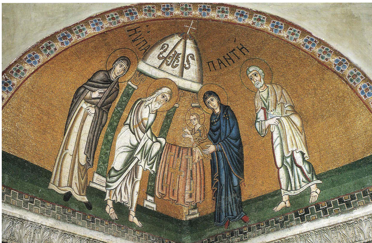
Сретение Господне. Мозаика. Византия. XI в. Греция. Фокида, монастырь Оснос Лукас

БОГОРОДИЦЕ ДЕВО, МИРУ БЛАГАЯ ПОМОЩНИЦЕ, ПОКРЫЙ И СОБЛЮДИ ОТ ВСЯКИЯ НУЖДЫ И ПЕЧАЛИ