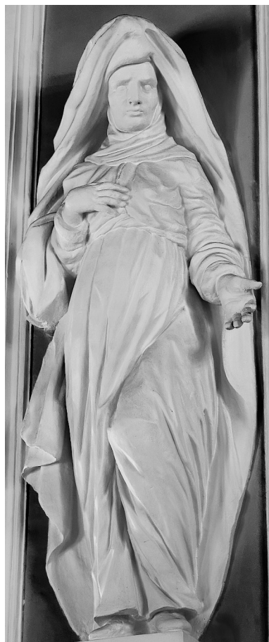
Дубровицы. Праведная Анна пророчица