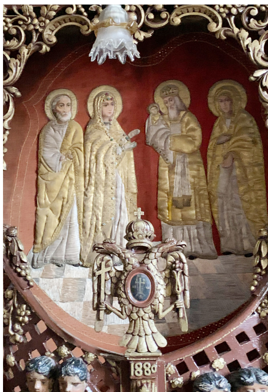
Завеса Царских врат в Сретенском приделе монастыря Катамон

Имя «Симеон» по-еврейски означает «услышание», а на греческом имеет тоже говорящее значение: