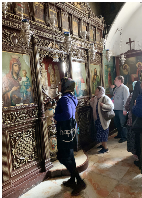
Иконостас главного придела монастыря

Новая история монастыря началась в середине XIX века, когда это место после многовекового запустения приобрёл монах Авраамий. После приобретения земли монастыря Катамон за 10 000 грошей в 1859 году Авраамий стал разбирать завалы и расчищать землю для разведения винограда и маслин. Во время работы были обнаружены остатки древних зданий с мозаичными полами, подземные водоемы, цистерны для сбора воды, куски мрамора с искусной резьбой, в том числе разбитая на куски колонна с грузинской надписью. Под обломками башни были найдены стены небольшого продолговатого помещения,