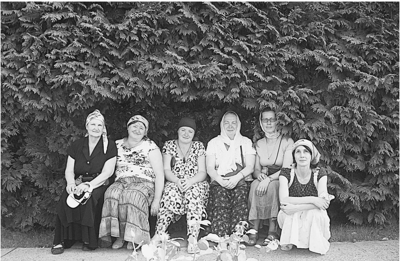
Дубровицкие паломники в Почаеве

Для чего мы отправляемся в паломничество? Ведь молиться можно и дома? Но мы отправляемся на встречу со святыней, чтобы что-то узнать о себе, чтобы вблизи почувствовать что-то. Приобщиться к благодати Божьей. Для того, чтобы что-то найти. Может быть – себя? Уходим от привычного круга вещей, чтобы меняться. Чтобы стряхнуть с себя окаменен-