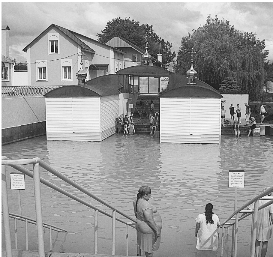
Купальня в скиту св. праведной Анны

Свои правила в свечном ящике. Например, на сорокоуст можно подавать только тех, кто причащается. Когда подаешь записки, обязательно спрашивают, откуда мы приехали. Это нужно для того, чтобы не принимать записок от раскольников.