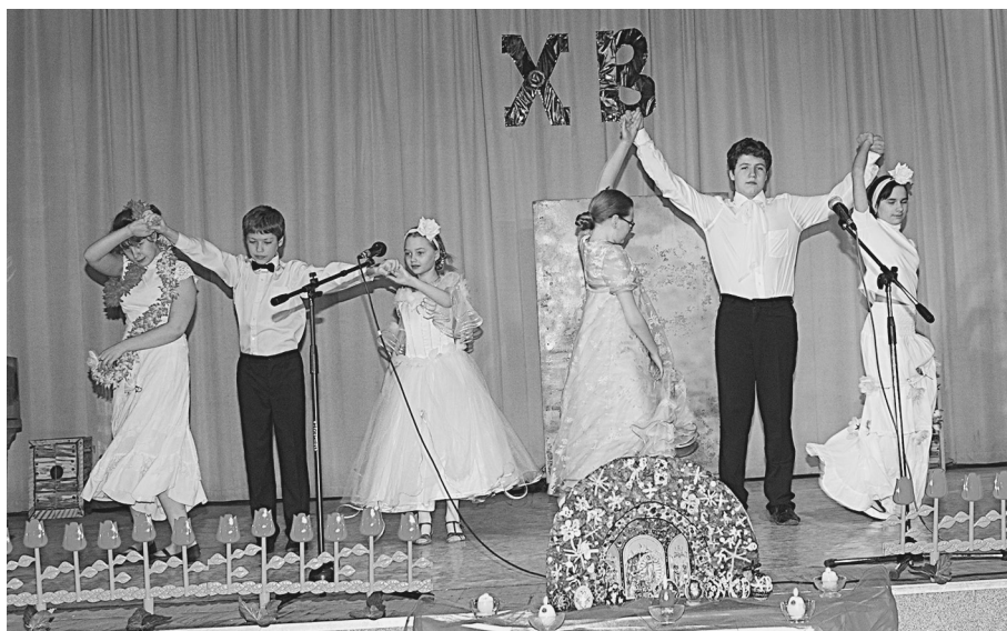
Пасхальный праздник воскресной школы