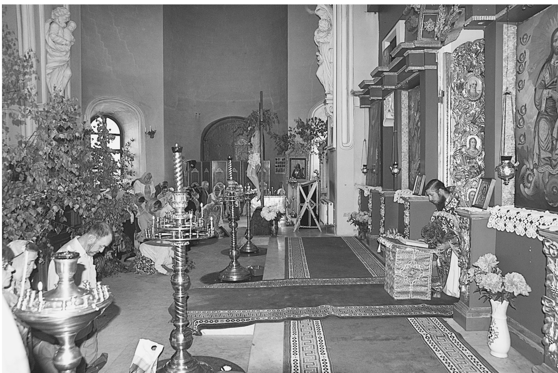
Троицкая вечерня в Дубровицком храме

По окончании всей службы государь со свитой возвращался во дворец, при чем пред Государем веночес один из ближних стольников.