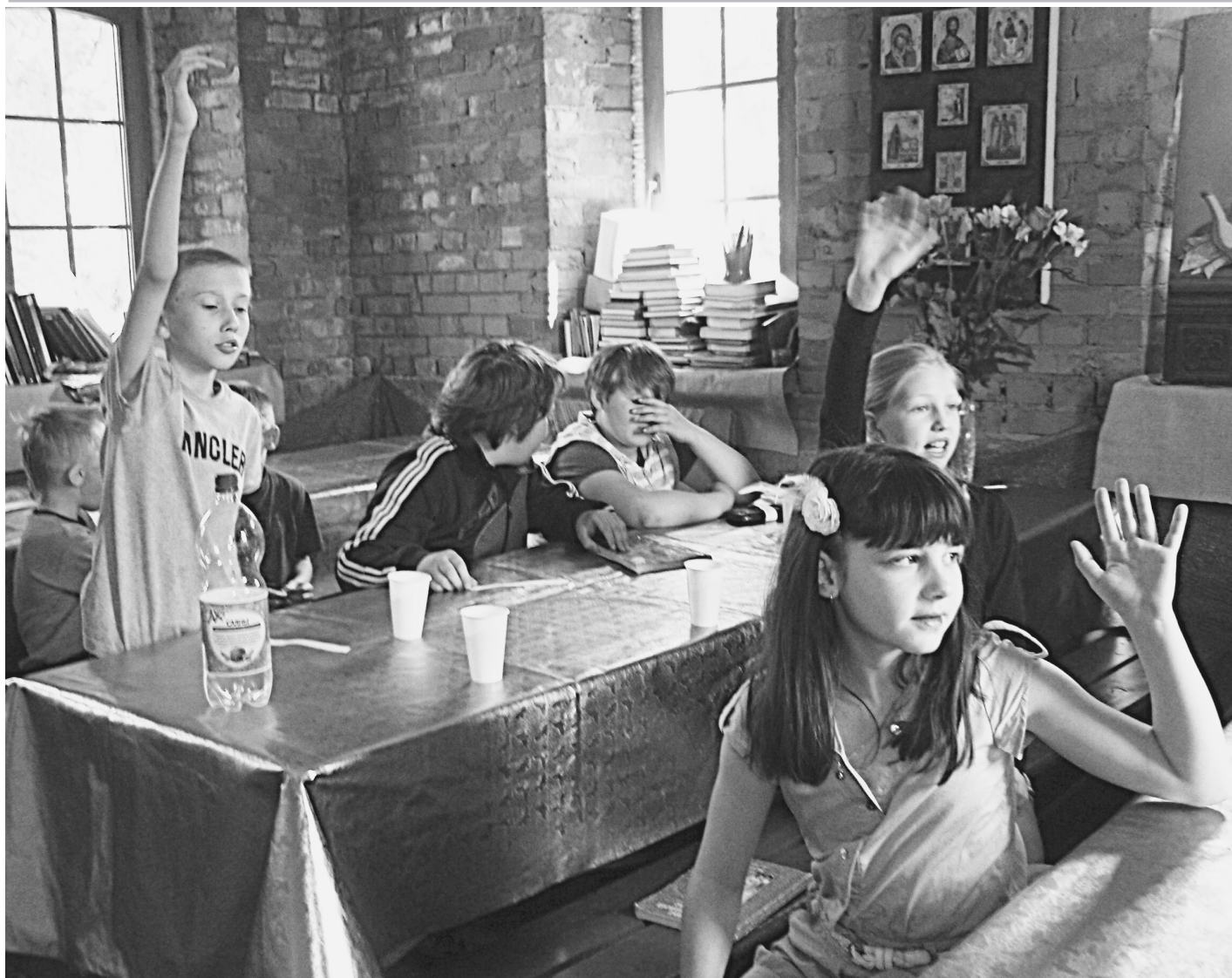
Экзамены в воскресной школе

проводить воскресные беседы со священником, приглашать интересных людей, организовывать концерты, семейные посиделки и даже летний православный лагерь для детей. И если мы вправе просить помощи у