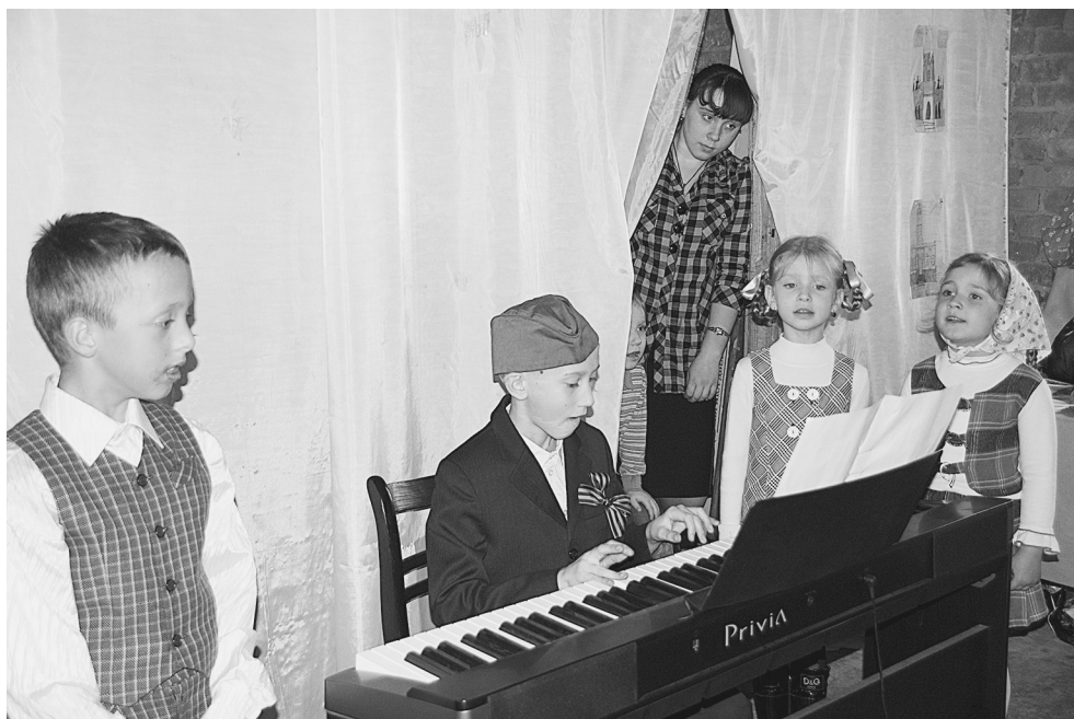
Концерт на 9 мая

А теперь мы обращаемся за помощью к тем, кто считает себя прихожанами нашего храма. Не случайно мы напомним о десятине. Ведь десятина, как сказал один батюшка, это - не мера денег, а мера любви. Надеемся наши прихожане любят свой храм и понимают, что для нормальной приходской жизни просто необходим церковный дом. Ведь в недостроенном флигеле занимается не только воскресная школа, но есть трапезная, в которой все прихожане собираются на праздничные трапезы. А в будущем там можно