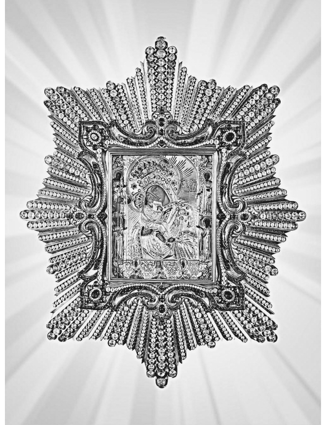
Чудотворная Почаевская икона Пресвятой Богородицы

нули повозку. Разгневанный граф вскинул пистолет. Только и успел кучер повернуться в сторону виднеющегося на горе монастыря и обратиться с молитвой к Божией Матери – и... осечка: первый, второй, и третий раз. Потоцкий ошарашено смотрит на свой пистолет, еще ни разу не подводивший его и переводит взгляд на кучера, полумертвого от страха. Чудо это