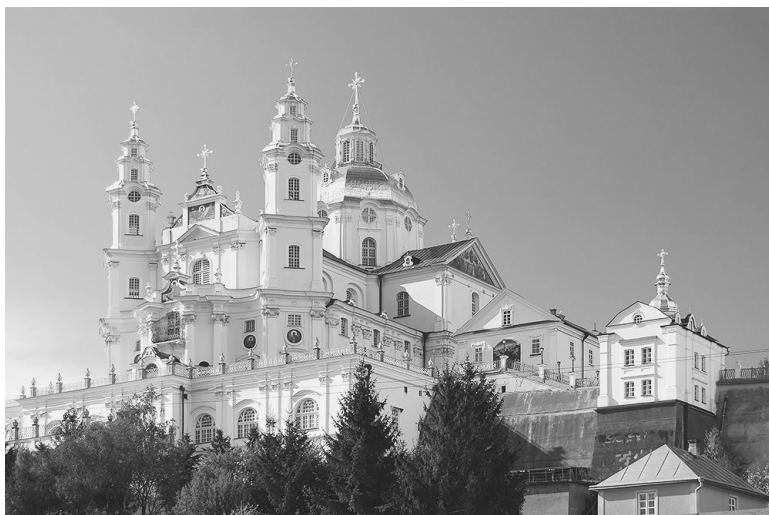
Вид на Свято-Успенский собор Почаевской Лавры

Много лет назад граф Николай Потоцкий ехал тут поблизости по своим важным графским делам. Вдруг лошади всполошились, понеслись и опроки-