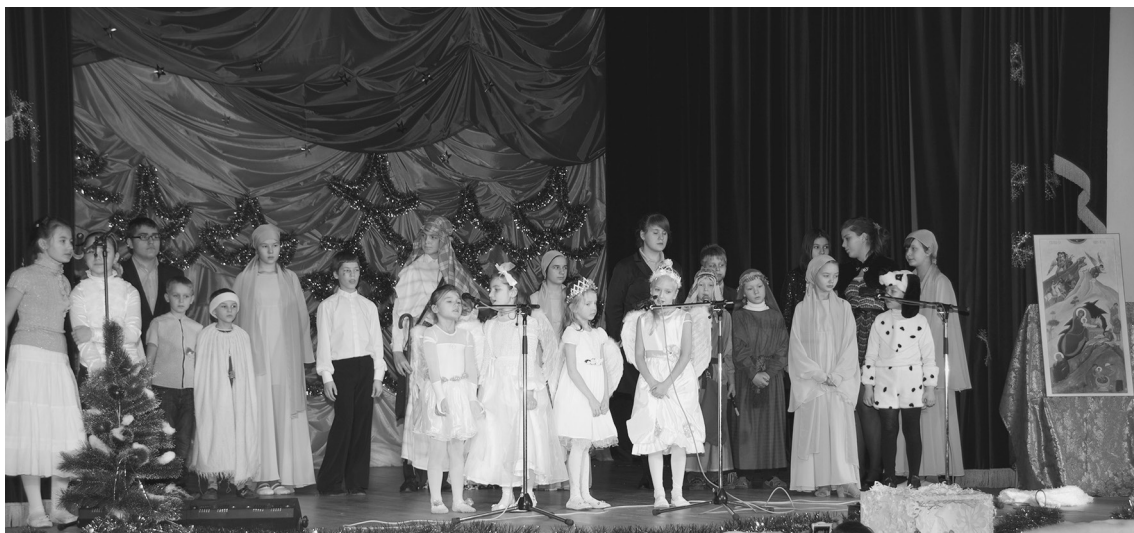
Дубровицкая воскресная школа на Рождественском фестивале в Толбино

В этом году 8 января прошел первый Рождественский фестиваль воскресных школ Подольского района, кстати по инициативе преподавателей Дубровицкой воскресной школы. Фестиваль прошел в Толбино, и на нем были представлены одиннадцать воскресных школ, в том числе и наша. Поболеть за своих и посмотреть на других поехали многие дети, родители и преподаватели нашей воскресной школы. Выступления были разноплановые и разнообразные. Мы представили небольшой спектакль по мотивам «Рождественской легенды» Сельмы