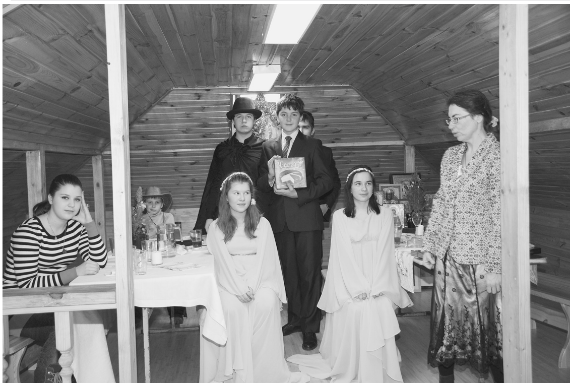
Участники праздника «Татьянин день» в Дубровицах