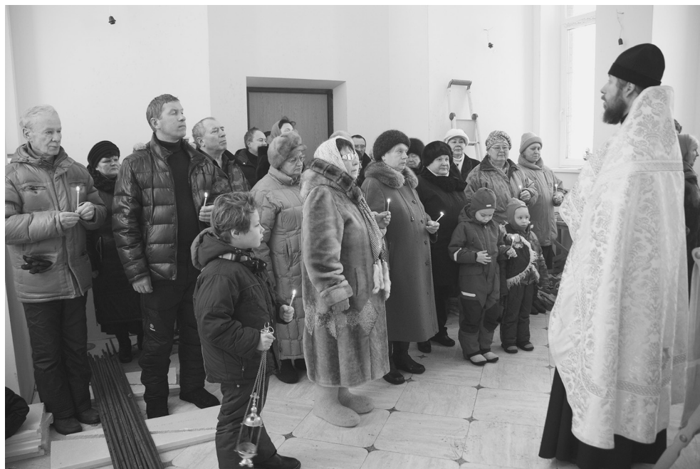
Служба в Уаровском храме деревни Булатово на Крещение Господне