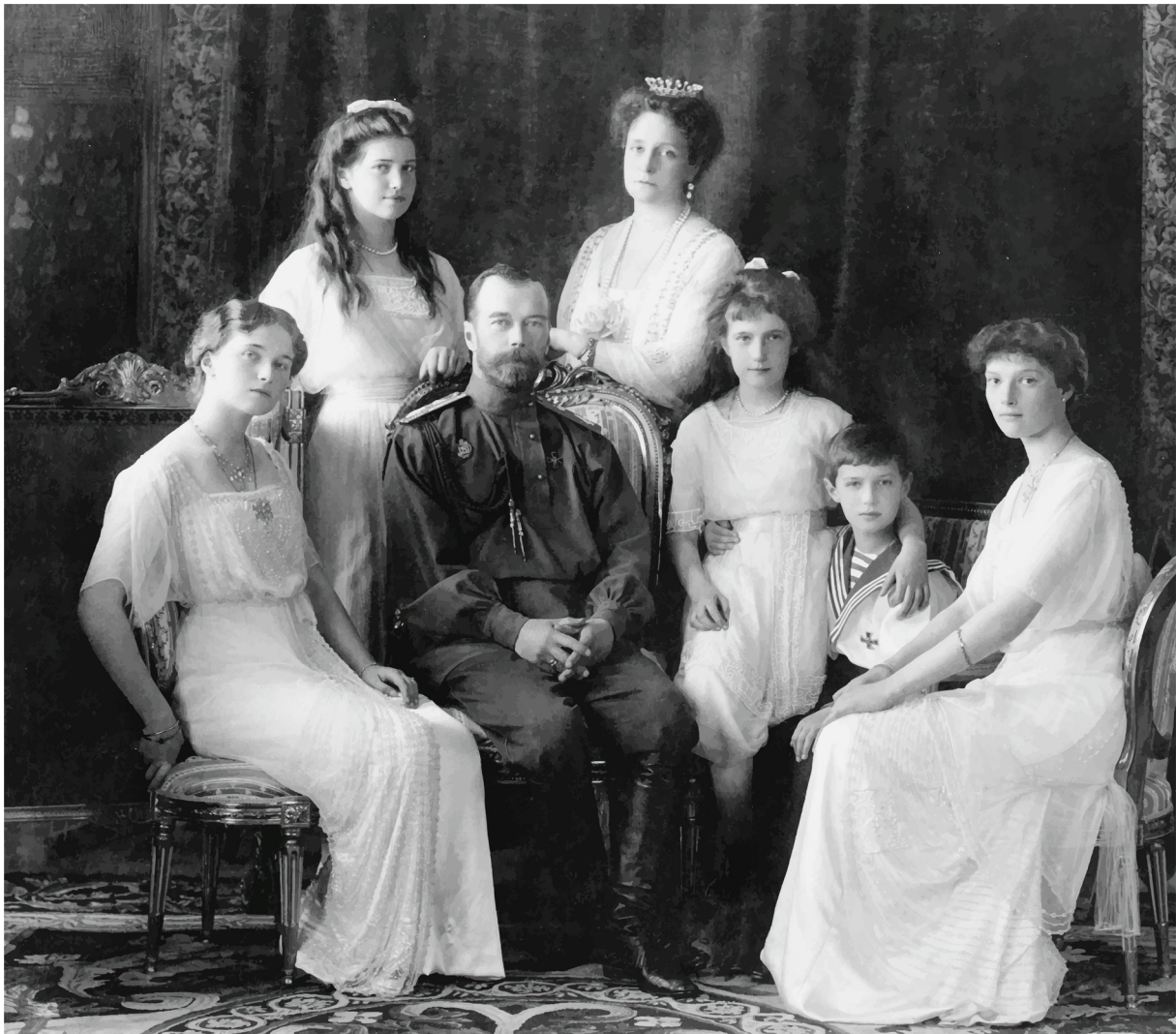
Царская семья 1913 год.

Государь и Государыня были образцом настоящей христианской семьи. Все Великие Княжны и Наследник воспитывались Императрицей в строго религиозном духе и в строгих требованиях внимательного отношения к каждому человеку без всякого осознания своего превосходства, а тем более кичливости своим высоким положением. Государь говорил детям: «Чем выше человек, тем скорее он должен помогать всем и никогда в обращении не напоминать своего положения. Таими должны быть и мои дети». Осуществляя сам в жизни этот принцип, Император воспитал в детях простоту, скромность, трудолюбие, открытость, правдивость,