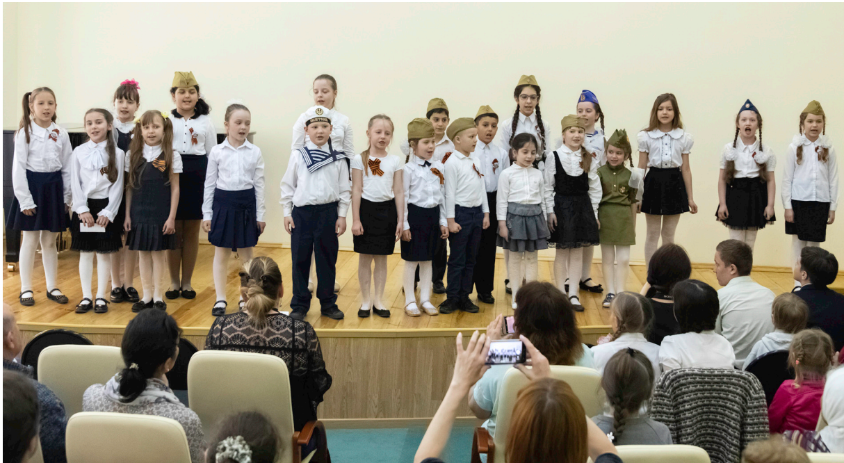
Выступление младшей группы воскресной школы в КПЦ Дубровицы

7 мая прошла акция «Кораблик Победы» совместно с центром «Семья». 25 семей детей-инвалидов участвовали в панихиде, запустили по реке Десне самодельные кораблики с именами героев войны, посмотрели концерт и пообедали в приходской трапезной.