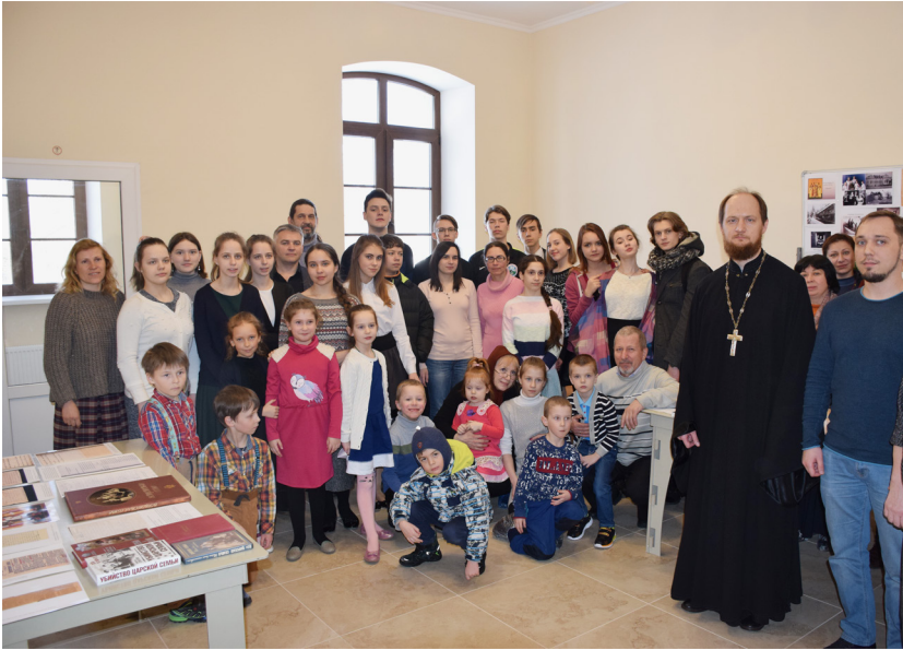
Воскресная школа в гостях в Чеховском благочинии

Мероприятия ко Дню православной книги в феврале-марте были посвящены 100 - летию трагических событий в истории России: