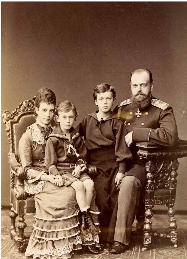
Цесаревич Александр Александрович с супругой Цесаревной Марией Феодоровной со старшими сыновьями. В центре 10-летний Великий князь Николай Александрович, будущий император Николай II

6 (19) мая 1868 года в семье наследника Цесаревича Александра Александровича и его супруги Марии