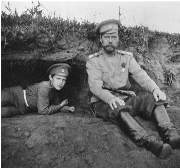
Император Николай II с наследником цесаревичем Алексеем на фронте

Государыня со всеми дочерьми отдавали большую часть времени работе в своих лазаретах. Императрица, княжны Ольга и Татьяна трудились как сестры милосердия, а младшие княжны Мария и Анастасия старались облегчить страдания раненых хотя бы своим присутствием. Мария часто выполняла поручения матери и раздавала