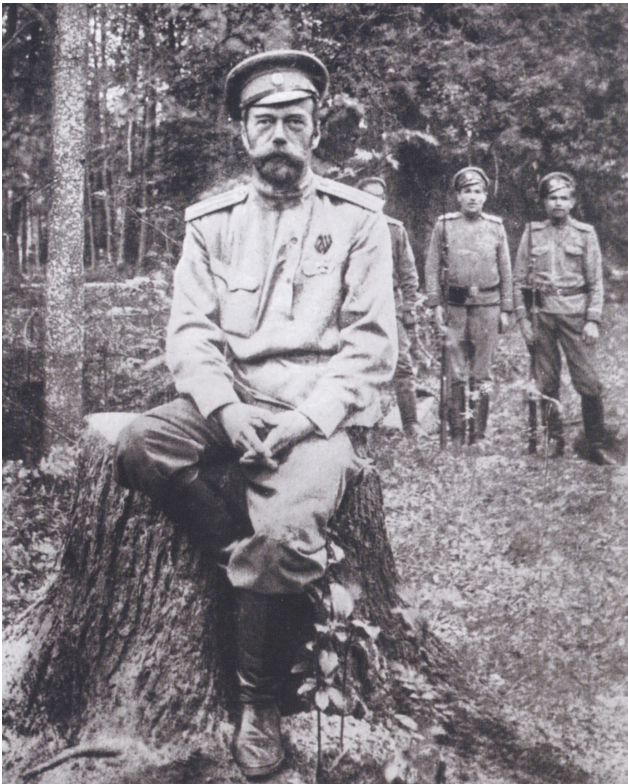
Император Николай II в заточении. 1917 год.

По союзному договору Россия после победы должна была получить Стамбул и проливы, соединяющие Чёрное море и Средиземное. Это усилило бы ее положение в Европе. Обладание черноморскими проливами - это давнишняя мечта России. Босфор и Дарданеллы давали