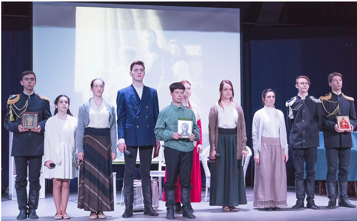
Спектакль театральной студии «Пилигримы» Знаменского храма, посвященный святым царственным мученикам в Троицкой Православной школе в Пучково

Основной побудительный мотив отречения императора — желание блага России и стремление избежать гражданской войны. Перед отречением государь говорил генералу Д. Н. Дубенскому: «Если я помеха счастью России и меня все стоящие ныне во главе ее