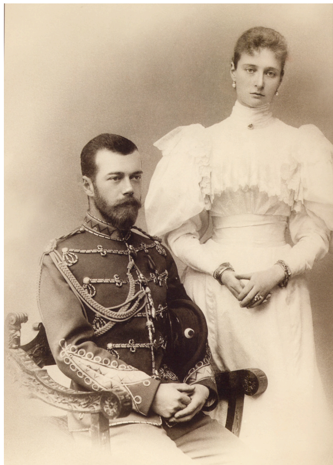
Император Николай II с супругой Императрицей Александрой Феодоровной. 1895 год.

«Вчера у Мама рассуждали о семейной жизни теперешней молодежи из общества: невольно этот разговор затронул самую живую струну моей души, затронул ту мечту и надежду, которыми я живу изо дня в день... Моя мечта - когда-нибудь жениться на Аликс Г. Я давно ее люблю, но еще глубже и сильнее с 1889 г., когда она провела шесть недель в Петербурге! Единственное препятствие