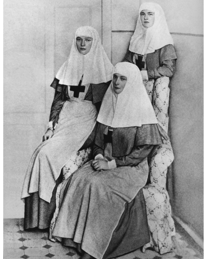
Сестры милосердия Императрица Александра Феодоровна и великие княжны Ольга и Татьяна Николаевны

вместе, Августейшие Отец или Мать прочитывали детям положенное на день Евангелие и Апостольское Послание. Отношения Августейших супругов отличались искренней любовью, сердечным взаимопониманием и глубокой преданностью друг другу. «Не верится, что сегодня двадцатилетие нашей свадьбы! - записал 27 ноября 1914 года в дневнике Николай Александрович. - Редким семейным счастьем Господь благословил нас; лишь бы суметь в течение оставшейся жизни оказаться достой-