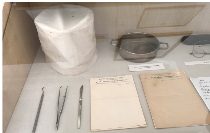
Вещи и медицинские инструменты святителя Луки в музее при Троицком кафедральном соборе г. Симферополя

как напутствие в жизнь». Особенно сильное впечатление произвели на него тогда такие евангельские слова: «Жатвы много, а делателей мало. Итак, молитесь Господина жатвы, чтобы выслал делателей на жатву Свою» (Мф. 9; 37). Ещё тогда у юного студента дрогнуло сердце и он молча воскликнул: «О Господи! Неужели у Тебя мало делателей?!». Через много лет, когда Господь призвал его делателем на ниву Свою, святитель вспоминал этот евангельский текст как первый призыв Божий на служение Ему.