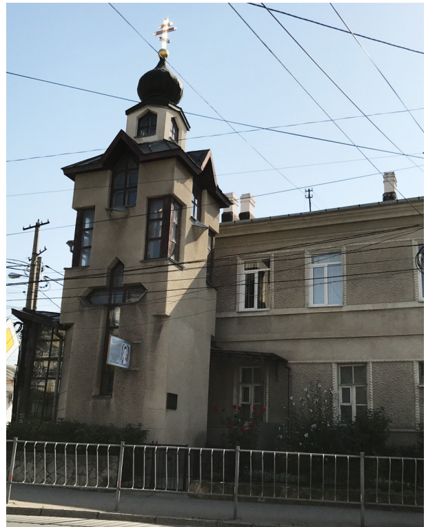
Дом в Симферополе, где жил святитель Лука. Сейчас там храм святителя Луки

не увидят свет до изменения отношения правительства к Церкви. В наши дни труды святителя стали доступны широкому кругу читателей.