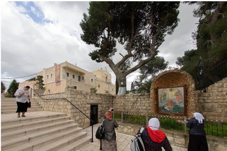
Православный монастырь на Фаворе и храм Преображения Господня

монументальные руины обширных древних христианских сооружений, являвшихся здесь бесспорно результатом важнейших и древнейших христианских преданий, связанных с этим священным местом”.