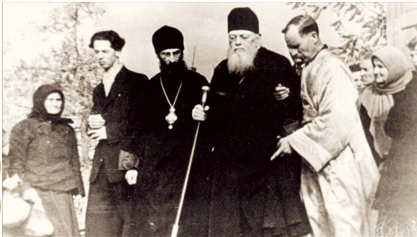
Святитель Лука после архиерейской службы в конце 50-х годов XX века

В Симферополь мы приехали накануне праздника Преображения Господня. Владыку дома мы не застали: он находился на маленькой даче, которую снимал в Алуште. Преосвященный Лука занимал во втором этаже весьма скромную квартиру из двух небольших комнат. В одной помещалась архиерейская келья, во второй, служившей приемной, столовой и кабинетом, все стены от пола до потолка были заняты полками с книгами - личной библиотекой архиепископа.