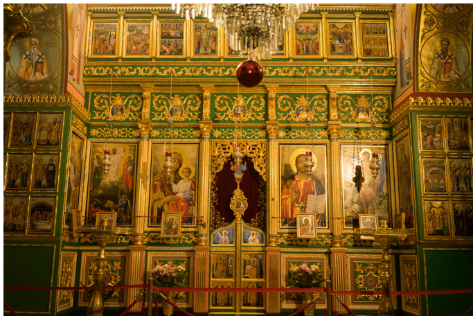
Главный иконостас храма Преображения Господня, выполненный русскими мастерами

Несколько позднее, чем было осуществлено православное строительство на горе Фавор, начались работы католическими монахами – францисканцами по восста-