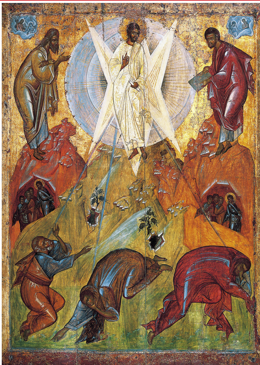
Феофан Грек. Преображение Господне. Копия иконы XV века