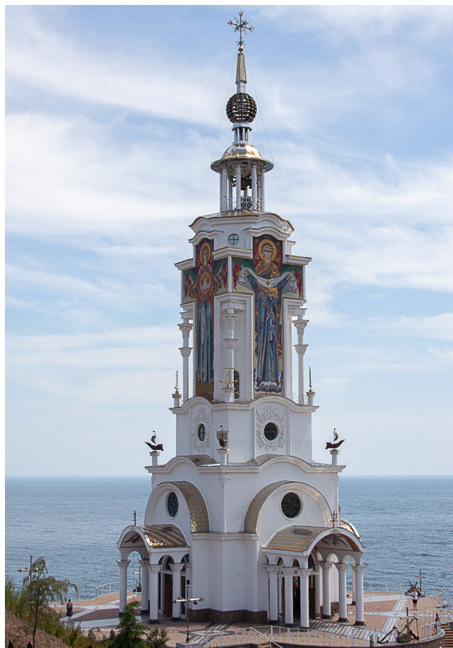
Храм-маяк святителя Николая в Малореченском

Семья между тем построила в селе Малореченское свой дом, истратив на это все свои сбережения. Чтобы