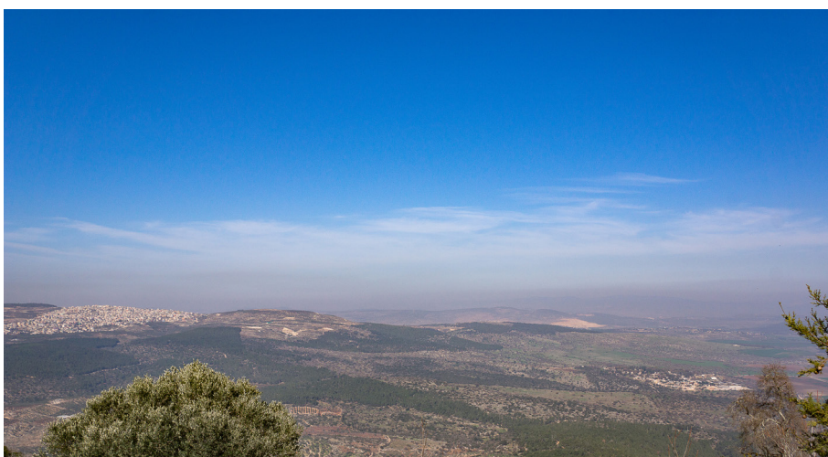
Вид с вершины Фавора. На дальнем плане слева Назарет

В XII веке на Святую Землю приходят крестоносцы, которые вносят свои изменения в положения о святых местах. Теперь значительную роль в судьбе Фаворских монастырей, (как и всех на Святой Земле), стали играть