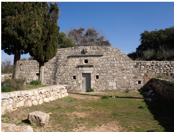
Пещера праотца Мелхиседека на Фаворе

Трагическому испытанию подвергаются оба монастыря в XII веке, когда Салах-ад-Дин в 1183 году подверг атаке греческий православный монастырь, монахи которого скрылись по подземному переходу в католическом, который был по своей постройке подобен крепости. Этот монастырь продержался еще до поражения крестоносцев в битве с мусульманами в 1187 году. После этого войска Салах-ад-Дина избили живущих на Фаворе христиан и выгнали отсюда всех монахов. В 1212 году брат Салах-ад-Дина Мелек-Адель воздвиг на вершине Фаворской горы грандиозную крепость для отражения нападений со стороны крестоносцев, державшихся еще в Птолемаиде. В 1263 году, когда господство мусульман прочно укрепилось на Святой Земле, по повелению тогдашнего султана все укрепления Фаворской горы были срыты, и памятником бывшей некогда здесь жизни оставались лишь груды камней и мусора. Анонимный греческий паломник 1253-54 года, говоря о Фаворской горе, замечает, что "на середине горы находится та пещера, в которой Мелхиседек пробыл 40 лет". О каких либо иных сооружениях здесь, монастырях или храмах он хранит полное молчание.