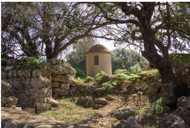
Древние развалины на Фаворе и место кельи архм.Иринарха

странствуя по Галилее решил поселиться вместе с сиротой – выходцем из своей родной деревни иеродиаконом Нестором на горе Фавор. Эти подвижники обустроили себе келью в виде пещерки в развалинах храма. Питались злаками и скромными подаяниями, приносимыми паломниками. Своими подвигами и строгостью жизни