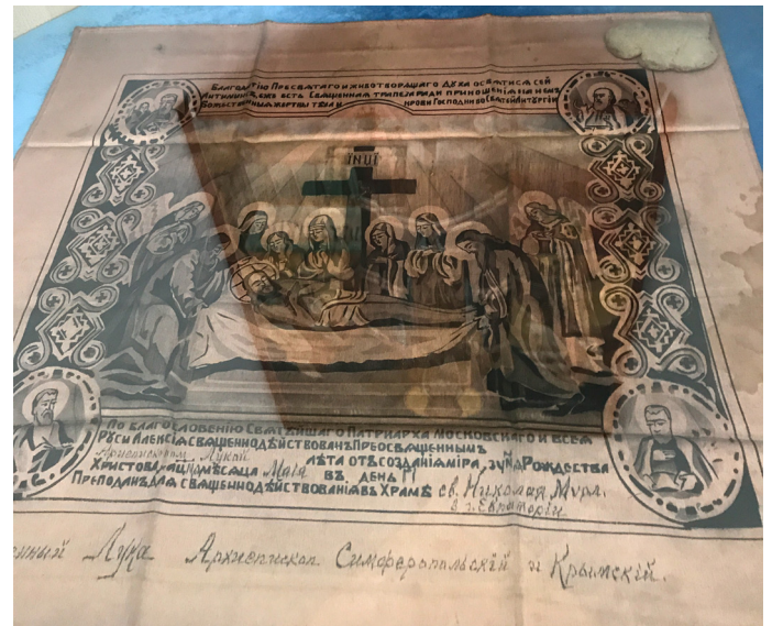
Антиминс, подписанный святителем Лукой для Никольского храма г. Евпатории

В мае 1946 года архиепископ Лука был переведён управлять Симферопольской и Крымской епархией. В Симферополе, в отличие от других городов, святителю Луке не дали возможности заниматься медицинской практикой и научной деятельностью. Но он продолжал принимать безвозмездно больных на дому и направил все силы на управление епархией, в которой