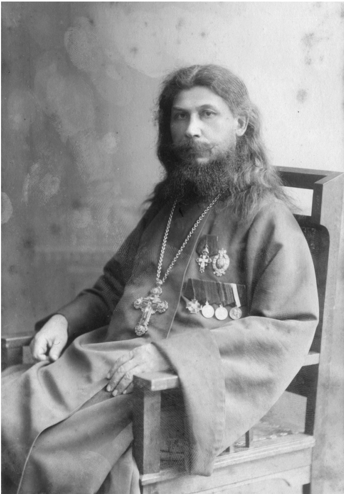
Протоиерей Николай Порецкий Фото 1913 года

особенности пастырскую, он был награжден митрой, двумя церковными орденами и тремя медалями.