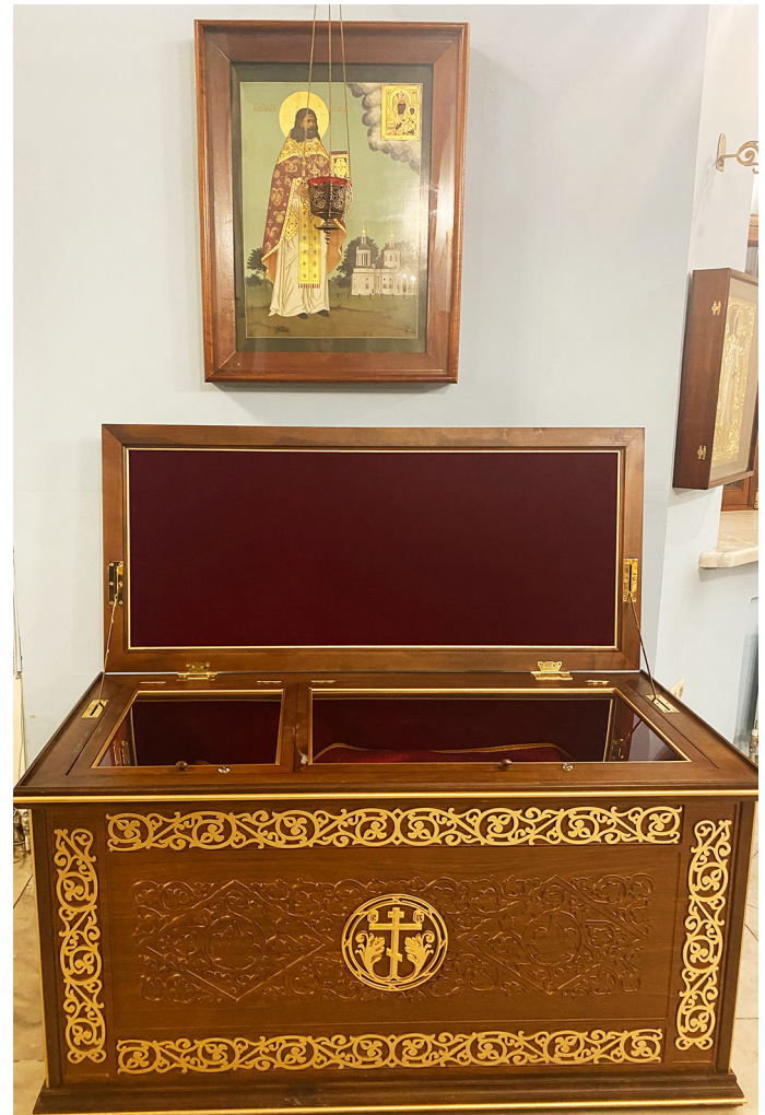
Рака с мощами и икона священномученика Николая

7 февраля 2021 года Русская Православная церковь праздновала Собор новомучеников и исповедников российских. На сегодняшний день в составе Собора – более 1700 имен. А сколько имен святых нам еще не явлено!