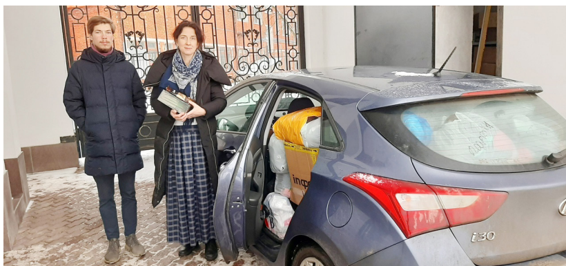
Перед отправкой волонтерской помощи в Тулу

Старикам трудно... Недавно в Климовском доме-интернате умерла бабушка, которой было 104 года. Доставили ее туда родственники месяца два назад в состоянии истощения и обезвоживания. Наверное, слишком устали