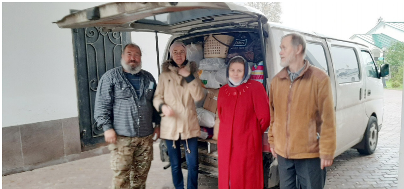
Волонтеры перед отправкой помощи в Ярославскую область

Разные люди приходят к нам в «Лавку добра». Бывает, что человек приносит ненужные вещи, а потом возвращается, но, уже желая послужить чем-то людям, сделать доброе дело для совершенно незнакомых людей, которым, быть может, еще больше, чем тебе в данный момент.