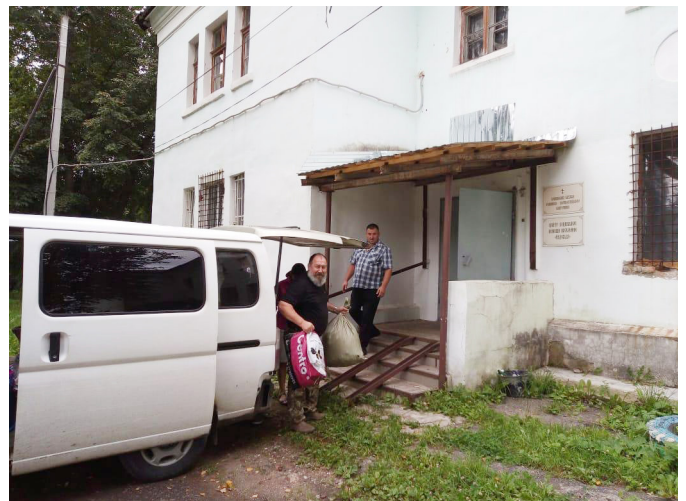
Разгрузка волонтерской помощи из Подольска в Тутаеве

К нам часто приходят бездомные. К сожалению, мы не можем направить их на путь исправления, но оказать небольшую помощь