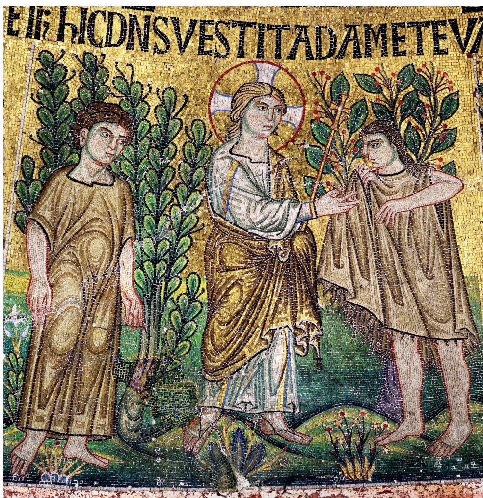
Бог одевает Адама и Еву в «кожаные» ризы. Мозаика XIII века. Собор св. Марка. Венеция