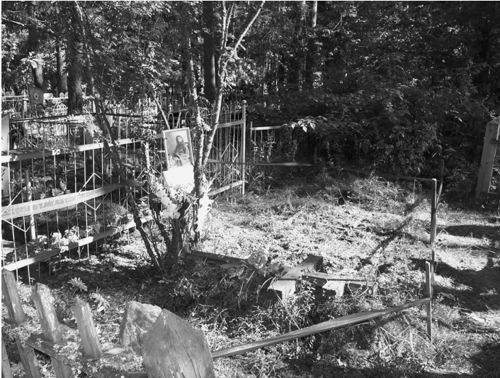
Место упокоения священномученика Николая Порецкого на кладбище в Шенкурске

человеческие останки. При визуальном осмотре установлено, что останки представлены в виде костного скелета. Фрагменты одежды и обуви не обнаружены; гроб сохранился в виде небольших фрагментов истлевшей древесины. Найдены 5 гвоздей, видимо, использовавшихся для скрепления частей гроба.