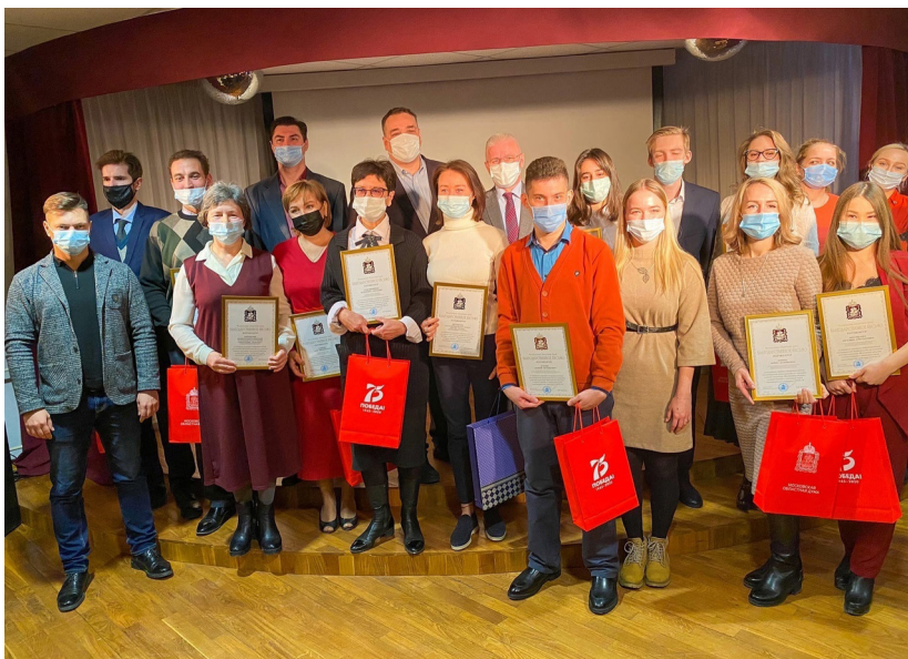
Волонтеры движения «Милосердие-Подольск»

Желающих расписать маленький имбирный пряничек в тот день было много, я еле успевала доставать из большой корзины свои пряники. А потом как-то так получилось, что я стала помогать в «Лавке добра» с сортировкой вещей, с отгрузками этих вещей в регионы, с документами, с поиском социальных служб при храмах в регионах, с помощью в решении самых разных просьб людей, приходящих в Лавку. И как-то я там прижилась и стараюсь выходить на дежурство раз в неделю уже второй год.