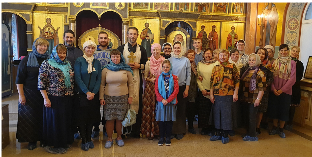
После волонтерского молебна

По традиции, в конце каждого месяца проводится волонтерский молебен Святителю Спиридону Тримифунтскому, небесному покровителю нашего движения (дата и время всегда есть на сайте http://podolskblog.ru , группа в vk.com/miloserdie_podolsk ). Общая