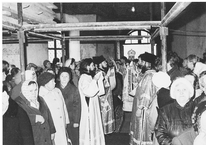
Первая литургия в Дубровицах 14 октября 1990 г.