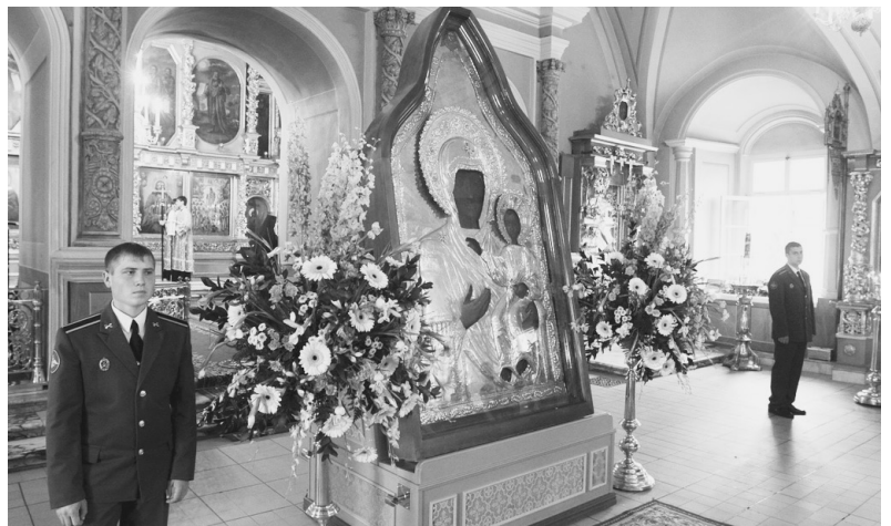
Смоленская икона в Новодевичьем монастыре. Сентябрь 2012 г.

200 - летний юбилей Отечественной войны 1812 года вспоминали и праздновали в этом году в России. Церковные торжества возглавил Святейший Патриарх Кирилл. 9 сентября в Храме Христа Спасителя, возведенном в честь победы над наполеоновскими захватчиками, Патриарх служил Божественную литургию в сослужении духовенства Москвы. А в Новодевичий монастырь привезли из Смоленска для поклонения чудотворную Смоленскую икону Божией Матери, которую забрали с собой наши войска, покидавшие Смоленск. Перед ней молилось все русское воинство накануне Бородинского сражения.