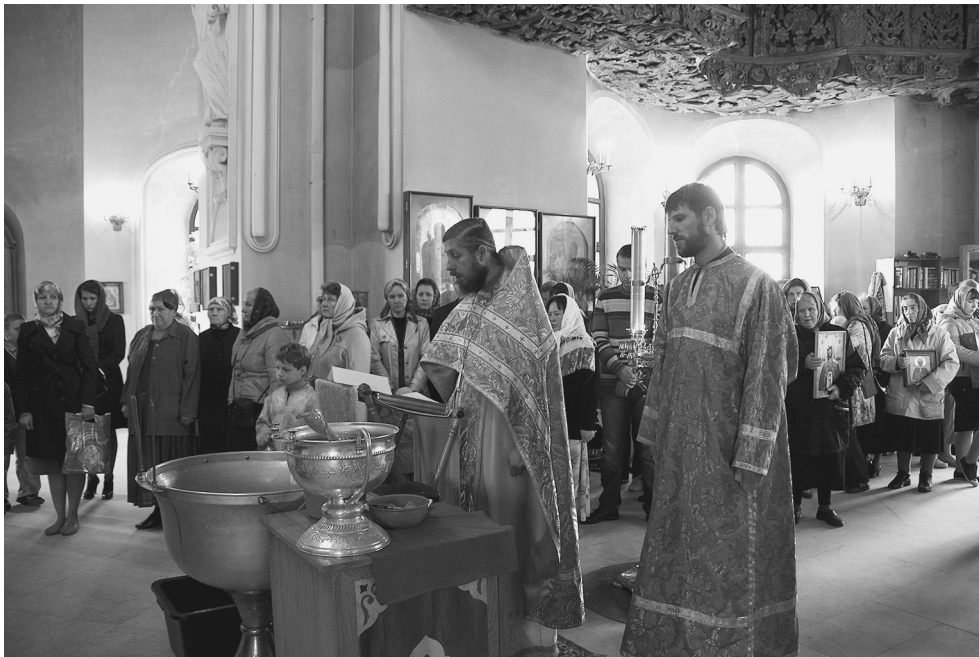
Молебен 8 сентября 2012 г. в память победы в Отечественной войне 1812 года

ственно, и не только в Дубровицах. Во всех храмах России по благословению Святейшего Патриарха служились благодарственные молебны и панихиды по погибшим воинам и военачальникам войны 1812 года. В нашем храме тоже собралось много прихожан, потому что 8 сентября празднуется еще и память святых мучеников Адриана и Наталии, в честь которых был теплый храм в колокольне, взорванной безбожниками в 1930 году. Поэтому после молебна состоялся крестный ход к месту, некогда освященному, и святость этого места неизменна навечно.