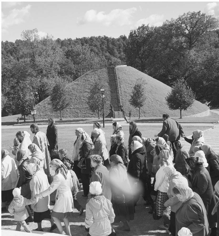
Смотровая площадка («курган») близ Знаменского храма

вдовы и матери погибших в этих сражениях воинов привозили тела погибших для захоронения в родной земле. И действительно, во время благоустройства территории вокруг храма находили останки от старых захоронений, и уже в наше время поставили памятный поклонный крест возле юго-восточной стены храма. Есть предположения, что на курган, который при князе Борисе Голицыне был смотровой площадкой, после войны 1812 года привозили землю с полей сражений женщины, не нашедшие своих погибших родных. А в