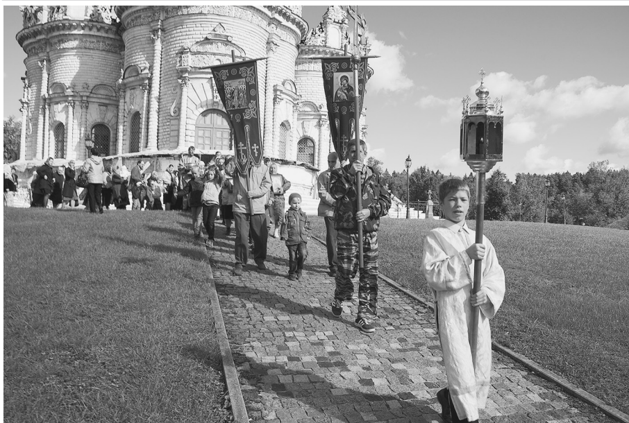
Крестный ход 8 сентября 2012 г. на место разрушенного храма-колокольни свв. мчч. Адриана и Наталии в Дубровицах

вдовы и матери погибших в этих сражениях воинов привозили тела погибших для захоронения в родной земле. И действительно, во время благоустройства территории вокруг храма находили останки от старых захоронений, и уже в наше время поставили памятный поклонный крест возле юго-восточной стены храма. Есть предположения, что на курган, который при князе Борисе Голицыне был смотровой площадкой, после войны 1812 года привозили землю с полей сражений женщины, не нашедшие своих погибших родных. А в