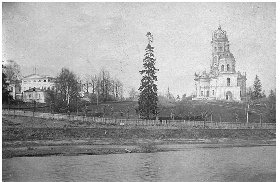
Вид на Знаменский храм с колокольней-храмом свв. мчч. Адриана и Наталии. 1929 г.