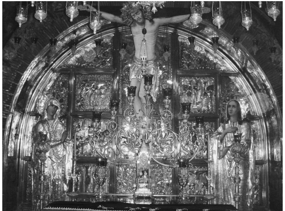
Голгофа. Место распятия Господа Иисуса Христа в притворе Иерусалимского храма Воскресения Христова

По свидетельству западной паломницы IV века Этерии, в Иерусалиме литургия в течение восьми пасхальных дней совершалась по определенному правилу от первого дня Воскресения до восьмого дня. В первый день, а также в понедельник и во вторник совершались службы в части храма Гроба Господня, называвшейся мартириум, в среду — на Елеонской (Масличной)