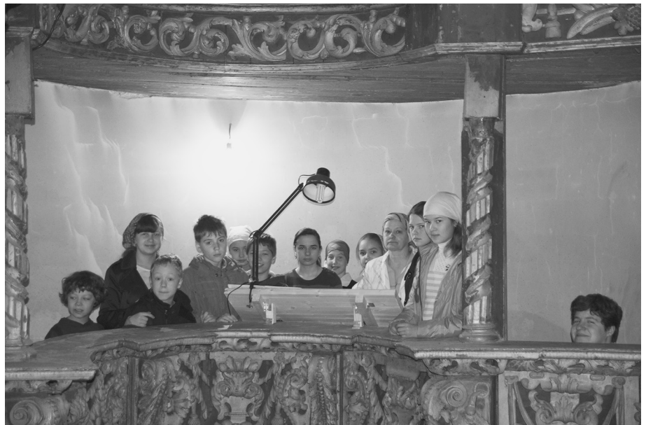
Детский хор на Божественной литургии

К празднику Благовещения было приурочено праздничное мероприятие - поездка учеников старших классов воскресной школы в театр Русской драмы на спектакль «Муромское чудо» о святых супругах благоверных князе Петре и княгине Февронии. Спектакль