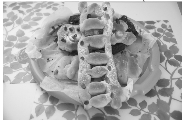
Лесенки из теста по традиции испекли в неделю прп. Иоанна Летсвичника дети воскресной школы

Чтобы у детей пост ассоциировался с весной, а значит с радостью, попытались сделать весенний календарь поста с тюльпанами и пушистыми вербочками. На нем отметили недели поста, памятные дни и праздники в те-