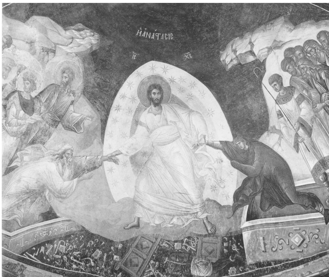
Сошествие во ад. Монастырь Хора. Фреска XIV века