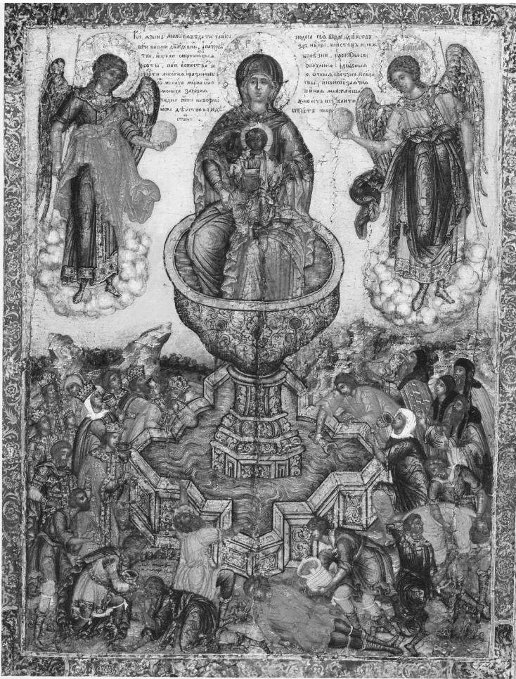
Икона Богородицы «Живоносный Источник»

тоуста на Книгу Бытия, на праздник Пасхи в Византийской империи существовал обычай освобождать заключенных, кроме рецидивистов, чему в 367 г. положил начало император Валентиниан. Закрывались суды, и разрешалось рассматривать лишь дела, касавшиеся освобождения рабов. В соответствии с правилом 72-м Карфагенского Собора (418) запрещались всякого рода низкие увеселения: конские ристалища, народные игры и публичные зрелища. Константинополь освещался торжественной праздничной иллюминацией — зажигались высокие столбы, подобные огненным лампадам, о чем отдал повеление, по сообщению Евсевия Кесарийского, еще равноапостольный император Константин в IV в. Все верные, следуя правилу 66-му VI Вселенского Собора, непрерывно упражнялись в псалмах и пении и песнях духовных, радуясь и торжествуя о Христе Воскресшем.