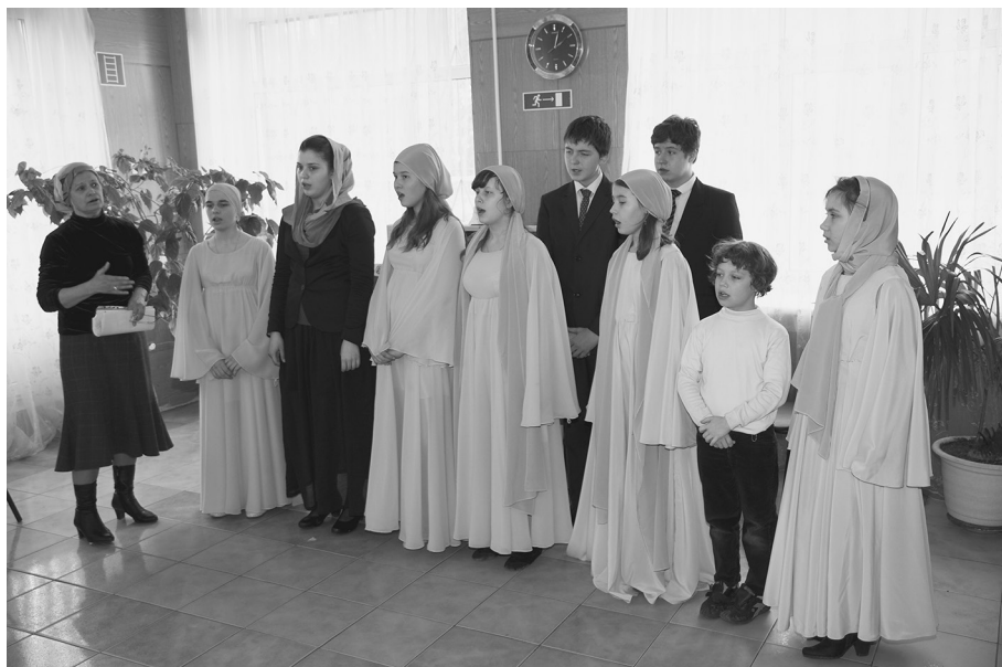
В социальном центре «Надежда» в Климовске на Благовещение

Пост в этом году начался поздно, в середине марта, и уже на первой неделе пришел первый праздник - память сорока Севастийских мучеников и воина мч. Феодора Тирона. Чему же нас могут научить эти святые воины? Они пострадали, приняли смерть в начале IV, когда гонения на христиан стихли, и близилось время эдикта императора св. равноапостольного Константина о веротерпимости. Но они не пошли ни на какие компромиссы