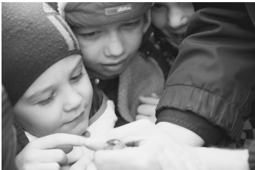
Дети воскресной школы выпускают птичек на Благовещение

Бога не бывает» (свмч. Игнатий Богоносец),