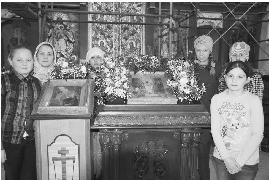
Девочки из кружка флористики украсили икону к празднику Благовещения