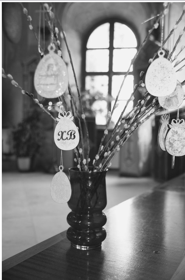
Праздничный пасхальный букет, сделанный руками детей.

А еще хочется особенно поблагодарить нашу по-