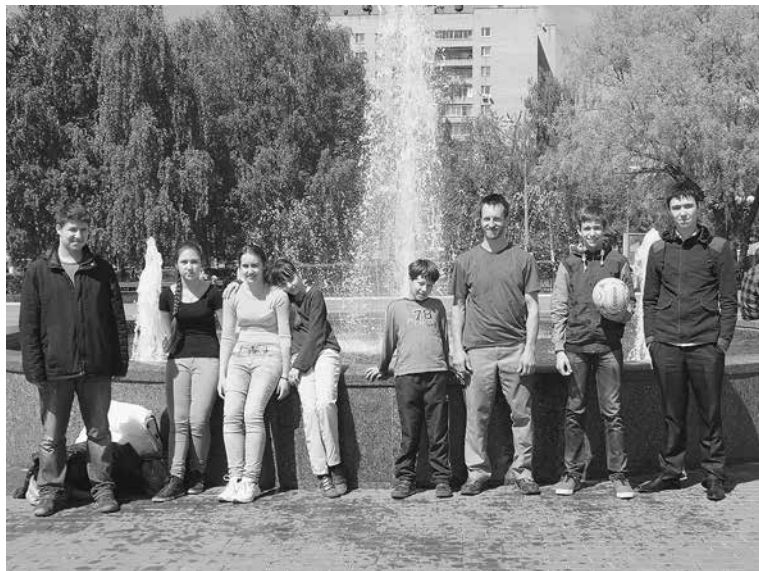
Ребята из Дубровицкой воскресной школы на молодежном слете в Красногорске

24 мая в день праздника славянской письменности в во всех классах прошли тематические занятия, а вокально-театральная группа нашей воскресной школы участвовала в празднике в молодежном центре «Максимум». Ребята показали спектакль и спели русские духовные песнопения.