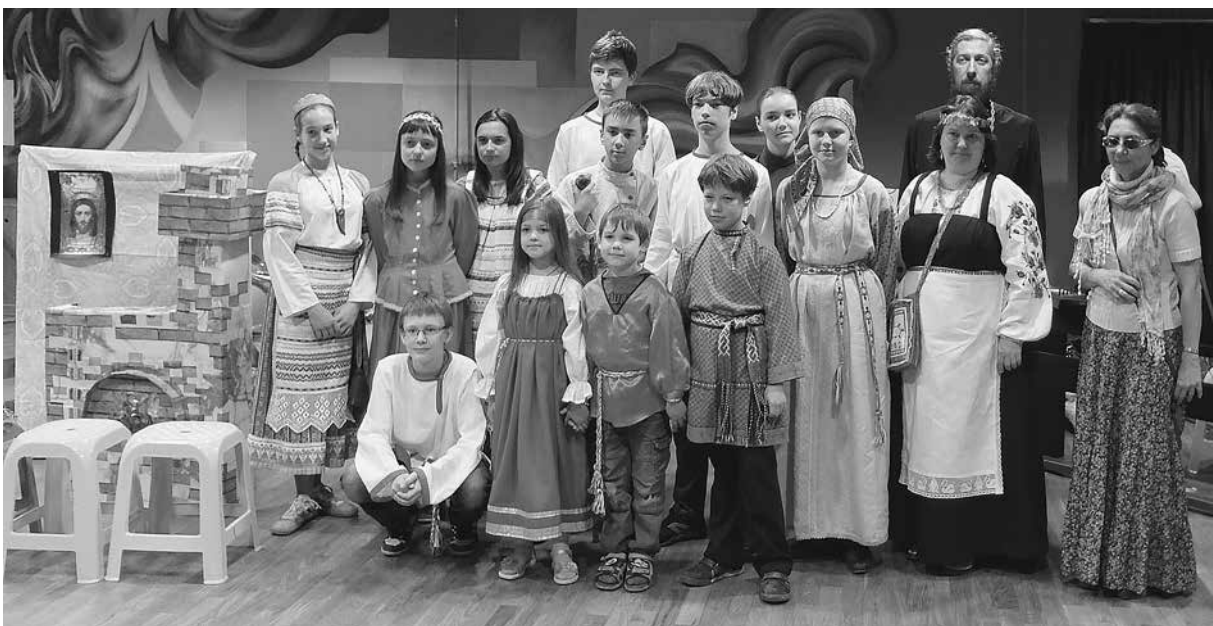
Участники спектакля «Маленький принц»