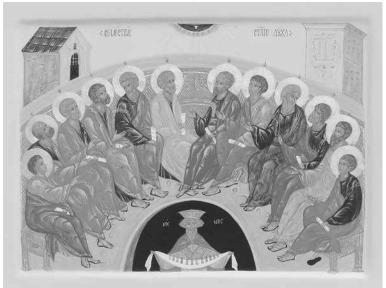
Икона Сошествия Святого Духа на апостолов

За первым чудом последовало другое, большее. Умея до сего времени говорить только на одном природном языке — еврейском, и притом на самом простом наречии его — галилейском, апостолы и прочие верующие вдруг начали говорить теперь на всех тогда известных языках. «И исполнились все Духа Святаго, и начали говорить на иных языках, как Дух давал им провещать». Апостолы вещали «величия Божии»,