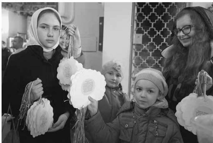
Участники акции «Белый цветок»

70-летию Великой Победы 1945 года было посвящено много концертов и праздников. 9 мая поздравляли ветеранов, дети вручили ветеранам самодельные письма-«треугольники» со словами благодарности. 10 мая для всех прихожан прошел концерт военной песни, в котором приняли участие ученики всех классов воскресной школы. Многие песни пели все вместе и «со слезами на глазах».