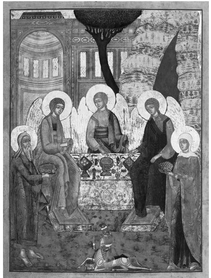
Икона «Явление Аврааму трех ангелов»

Ангел, изображенный в левой части иконы, облачен в синее нижнее одеяние, символ божественной, небесной природы, а светло-лиловое верхнее свидетельствует о божественной непостижимости и царственном достоинстве. Над его головой возвышается здание, жилище Авраама. Дом явля-