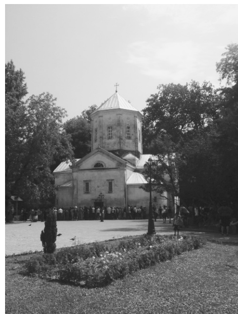
Влахернская церковь в Зугдиди

Частицы пояса Пресвятой Богородицы также хранятся во Влахернской церкви в г. Зугдиди в Грузии и в двух московских храмах: Св. пророка Ильи «Обыденного» на Остоженке и Рождества Пресвятой Богородицы в Старом Симонове. Часть, хранящаяся в Грузии, привезена в XI веке племянницей императора Романа III, ставшей женой грузинского царя Баграта IV. В начале XIX века Нино, дочь царя Георгия XII, после принятия российского подданства, прислала часть пояса в дар императору Александру I, который, украсив его драгоценными камнями, вернул обратно и повелел построить в Зугдиди церковь для хранения реликвии.