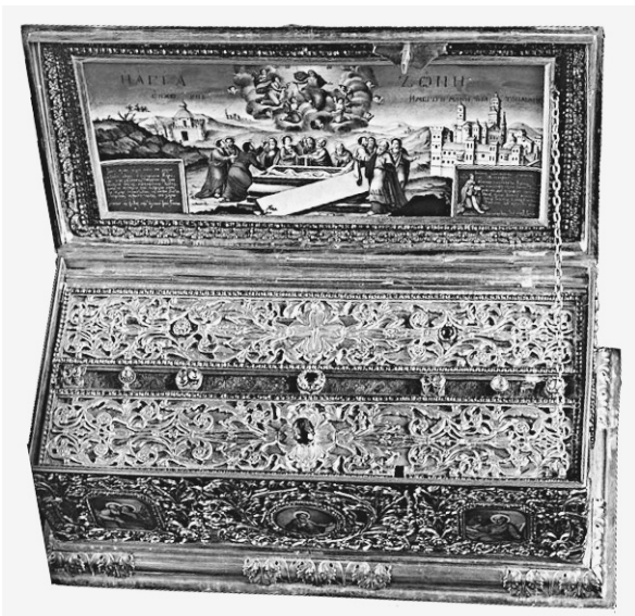
Ковчег с поясом Пресвятой Богородицы из афонского монастыря Ватопед

В первые века христианской эры он находился в Иерусалиме. Известно, что в IV веке он хранился в каппадокийском городе Зела, и в этом же веке император Феодосий Великий вновь привез его в Иерусалим. Оттуда его сын Аркадий доставил Пояс в Константи-