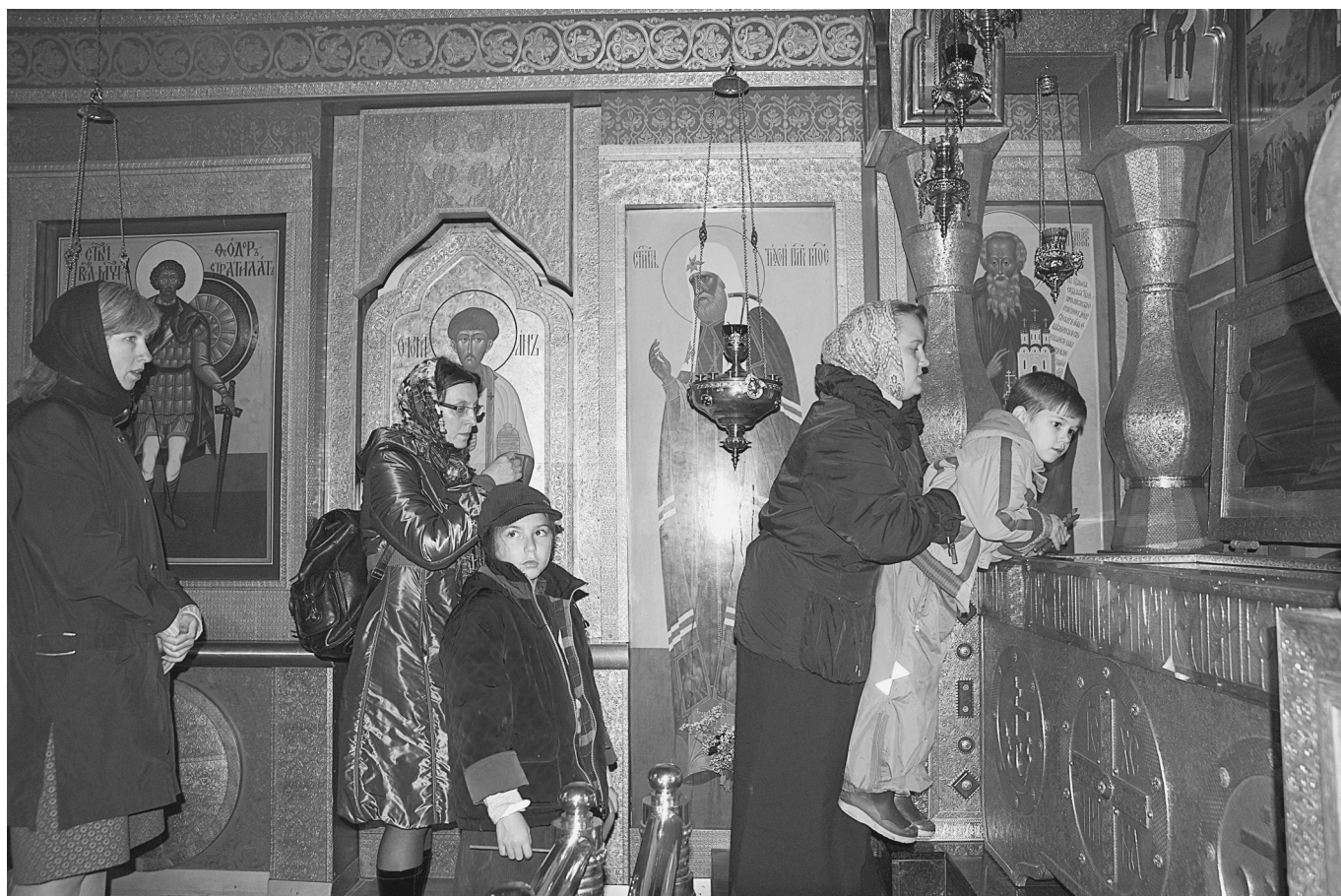
У мощей прп. Пафнутия Боровского