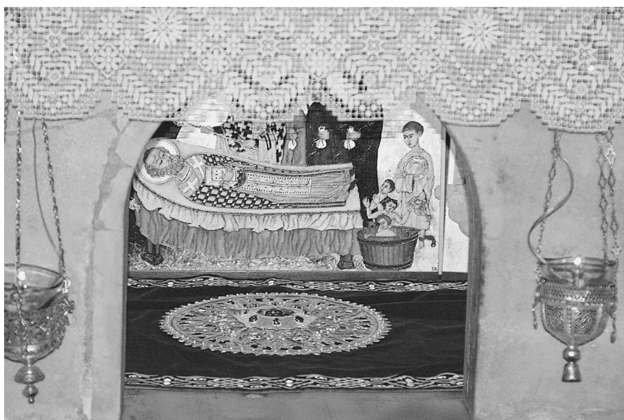
Крипта базилики святителя Николая в Бари. Под католическим престолом находятся мощи святителя Николая.

Так вот, ежегодно 22 мая святое миро собирается и растворяется в святой воде, освященной на мощах