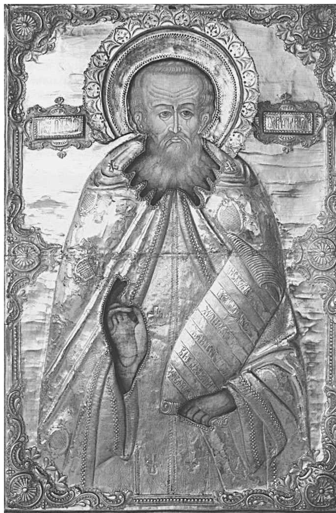
Икона прп. Пафнутия Боровского