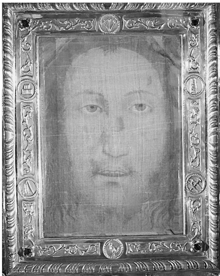
Образ Господа Иисуса Христа на плате святой Вероники в Манопелло

Да, в наших православных СМИ о нем как-то