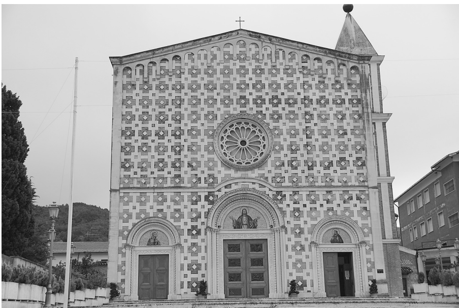
Базилика капуцинского монастыря в Манопелло

разная, порой трагическая, судьба. Так, Животворящее Древо Господне, вообще не сохранилось. Вероятнее всего оно было раздроблено на множество частей и рассеялось по всей Европе. Поэтому неудивительно, что сейчас во многих монастырях и храмах в драгоценных ковчегах хранятся и главное доступны для поклонения частицы Святого Древа. А вот Терновый Венец сохранился и находится сейчас в Париже в часовне Сен-Шапель. Плащаница Господа нашего Иисуса Христа, в которую Он был обернут после снятия со Креста и на которой отобразилось Его Тело, так-