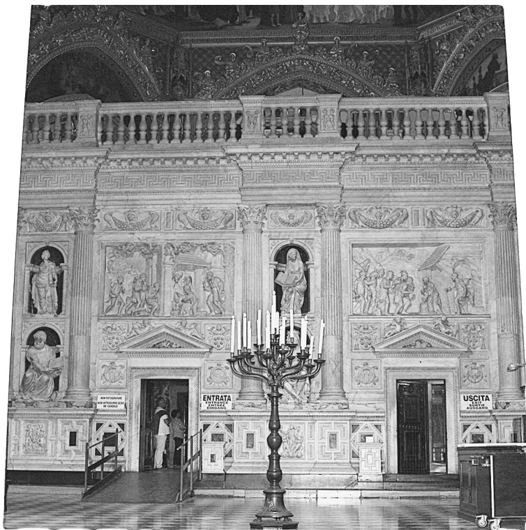
Мраморный чехол Дома Пресвятой Богородицы в Лорето

менными исследованиями) размером 9 на 4 метра и высотой 3 метра апостолы бережно хранили, превратив в церковь. Позднее, в 70 - годах после Рождества Христова римляне разграбили и опустошили Святую Землю в наказание за восстание евреев, но Дом Пресвятой Богородицы чудом уцелел. Спустя три столетия в IV веке святая равноапостольная царица Елена