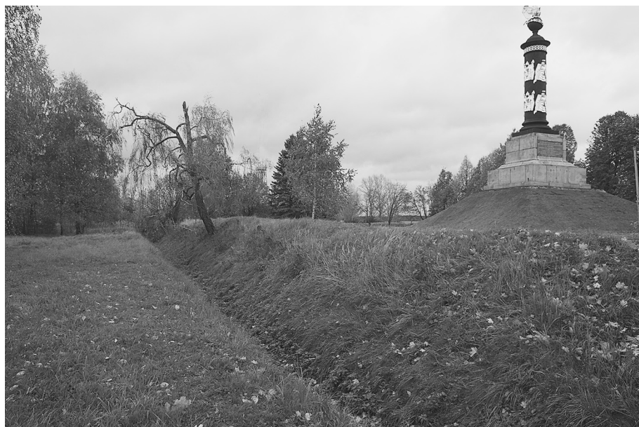
Памятник русским воинам в Тарутино и ров времен Отечественной войны 1812 г.

Один из первых памятников, «в знак освобождения в 1812 году России от неприятеля» был открыт 24 июня (ст. ст.) 1834 г. в с. Тарутине Боровского уезда Калужской губернии.