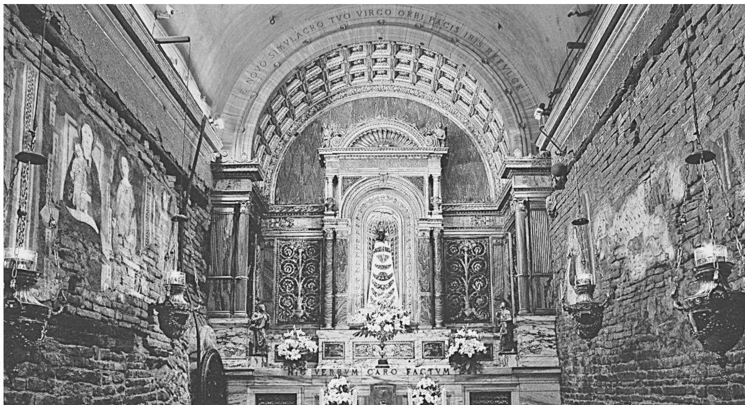
Дом Пресвятой Богородицы в Лорето. Внутренний вид

Дом состоит из трех стен, в южной устроен вход,