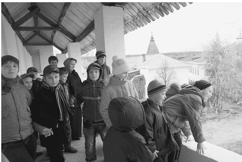
Воскресная школа Дубровицкого храма на стенах монастыря

Наша экскурсия закончилась в главном соборе