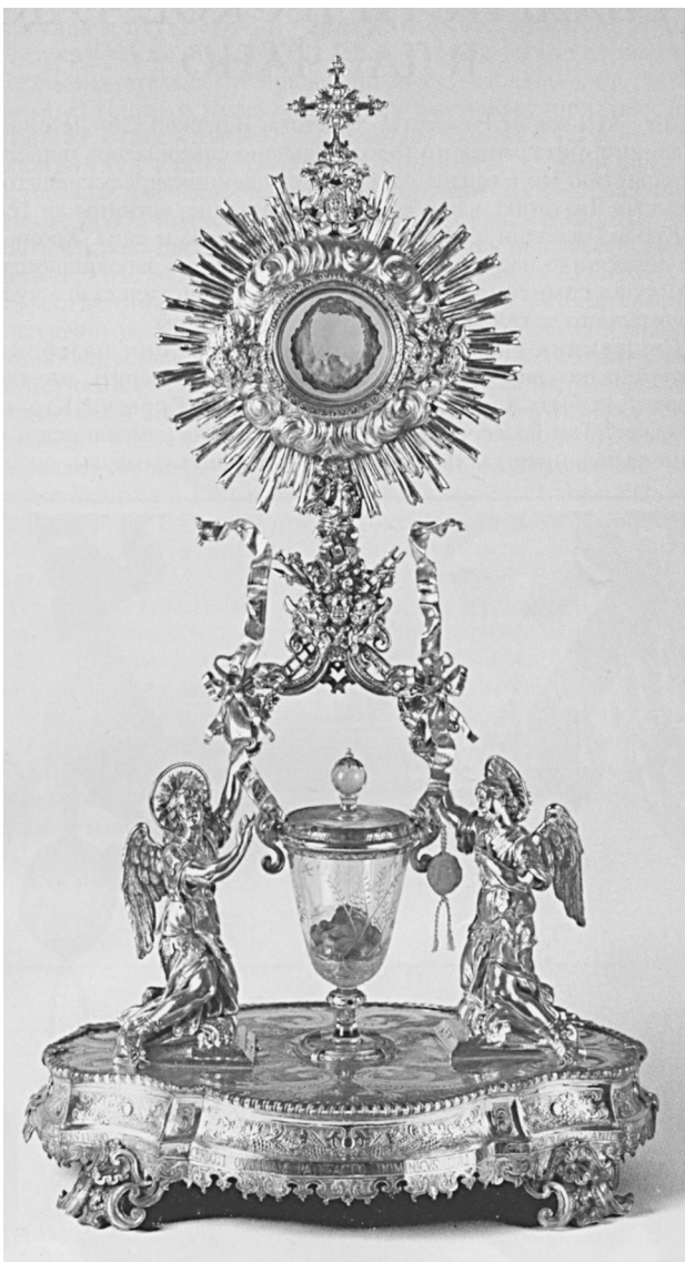
Ковчег с главными святынями Ланчано

Сейчас Кровь хранится в античной чаше из цельного куска горного хрусталя. Чашу поддерживают два ангела. А над ней в небольшом круглом сосуде