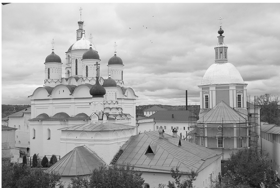
Вид на Пафнутьево-Боровский монастырь

В городе очень скоро узнали о смерти подвиж-