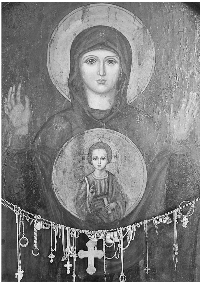
Дубровицкая икона «Знамение» до реставрации

городица молится за нас...». И тут же прекратилась атака, и новгородцы увидели, как в стане нападающих произошло сильнейшее замешательство: одни метались, будто потеряв разум, другие дрались между собой. Этим новгородцы воспользовались. Ободренные Иконой, благословленные епископом, они ринулись в атаку и победили... Это великое чудо, подробно изложено в Новгородской летописи, а также в акафисте в честь иконы «Знамение». Икона эта очень любима на Руси. Она является не только памятью о великом чуде – Знамении того, что Богородица не оставила новгородцев, окруженных превосходящим по силе врагом, но и стала символом примирения. Икона «Знамение» и сейчас находится в Новгороде, в Софийском соборе. С нее много списков, и наша икона «Знамение» в их числе. Именно в честь иконы «Знамение» Пресвятой Богородицы был построен в Дубровицах храм. Так что эта икона – главная святыня нашей церкви. Но и она в шестидесятые годы двадцатого века не избежала печальной участи: валялась в строительном мусоре. В отличие от других крупных икон ее не успели осквернить - спасли раньше.