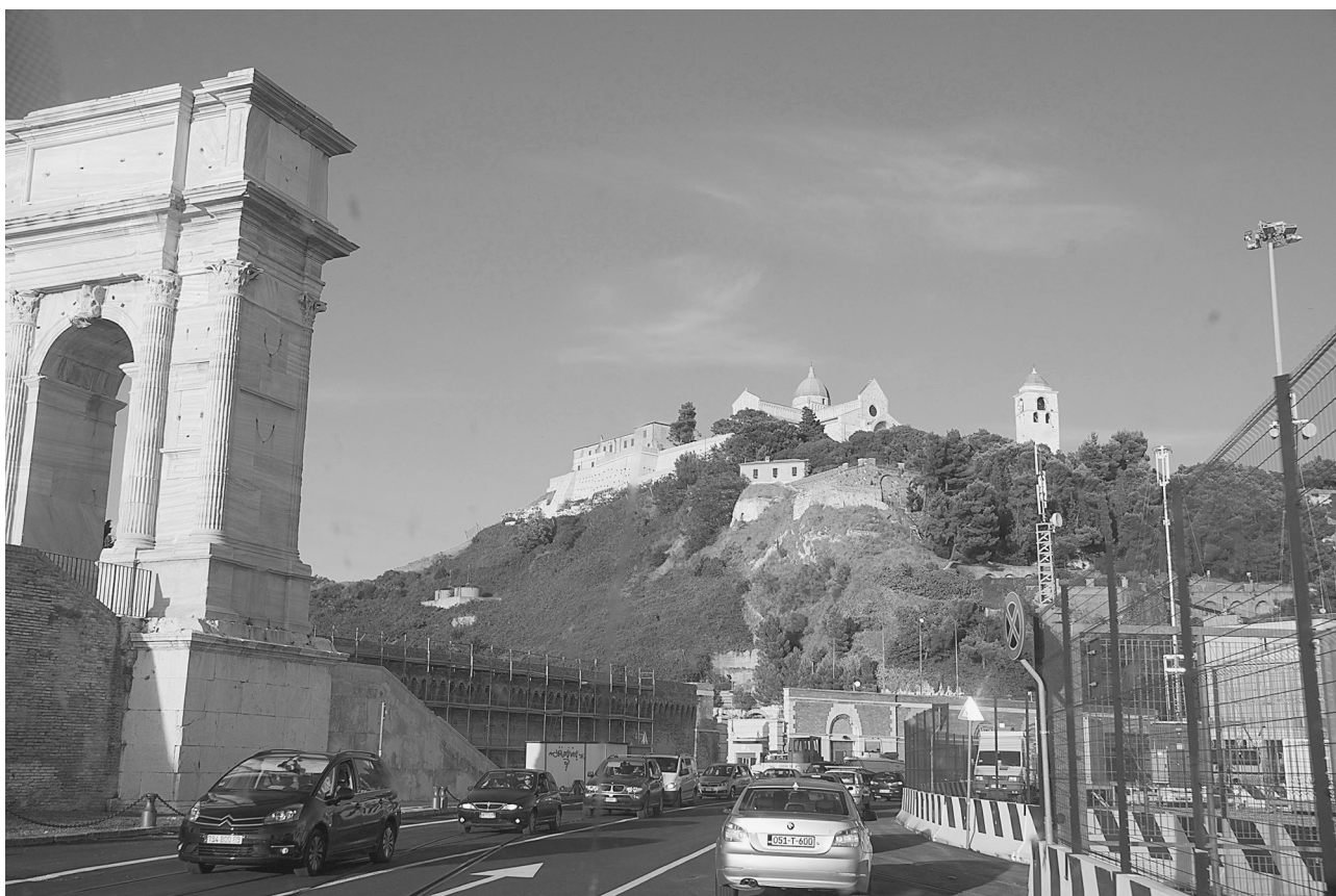
Порт Анконы. Вид на старинную часть города с кафедральным собором святителя Кириака