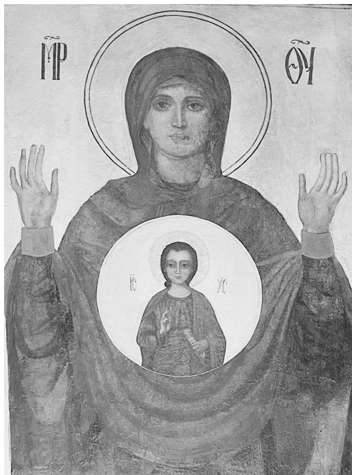
Дубровицкая икона «Знамение» после реставрации