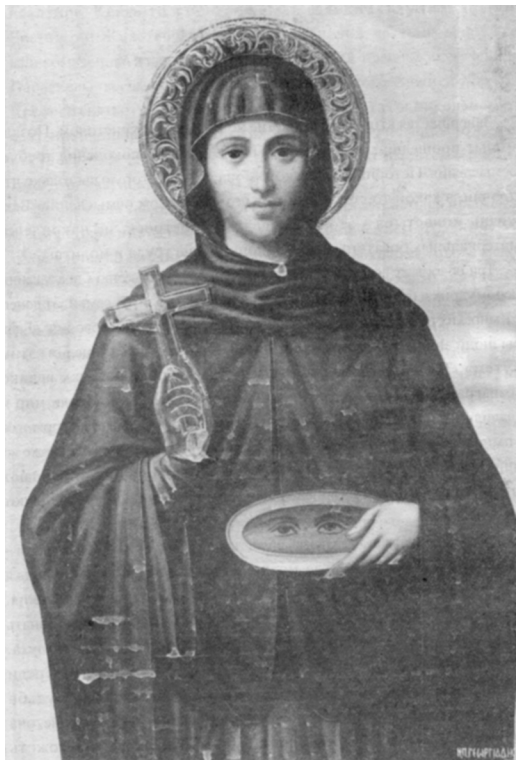
Икона св. преподобномученицы Параскевы из Топловского монастыря

Жизнеописание св. преподобно-мученицы Параскевы повествует следующее: она родилась в Риме, в семье благочестивых христиан, Агафона и Политии. Они долгое время не имели детей, и только после горячих молитв Господь даровал им единственную дочь Параскеву, названную так потому, что она родилась в пятницу (Параскева - пятница - греч. ). Даты ее рождения и кончины точно не известны. Время жизни ее относилось к царствованию римского императора Антонина. В Риме правили два Антонина - Антонин Пий (138-161 гг. н. э.) и Антонин Философ (161-180 гг. н.э.), и в правление которого из них жила Параскева, неизвестно.