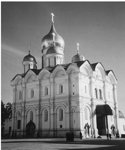
Архангельский собор в Кремле