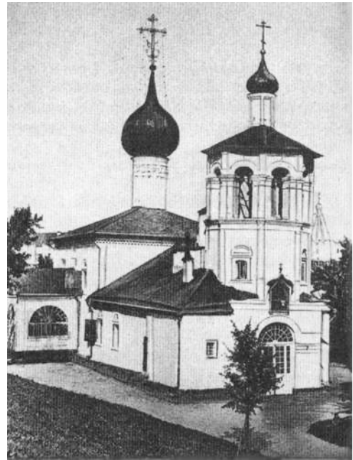
Церковь свв. равноап. Константина и Елены

Одним из направлений пастырской деятельности батюшки было просвещение людей, православных по рождению, но далеких от Церкви по своей жизни. Таких было немало как среди интеллигенции и аристократов, порой склонных к гордости по причине учености или увлекавшихся светской жизнью, так и среди простого народа, часто невежественного в вопросах веры и спустя многие века