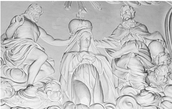
Коронование Богородицы. Богоявленский собор. Москва. Китай-город. Начало XVIII века.

гоявленском храме («Рождество Христово» и «Крещение Господне»). Кроме того, в обоих храмах одно из центральных мест занимает сцена, более распространенная в католической, чем в православной традиции, - «Коронование Пресвятой Богородицы». В нашем храме она расположена над алтарем в тре-