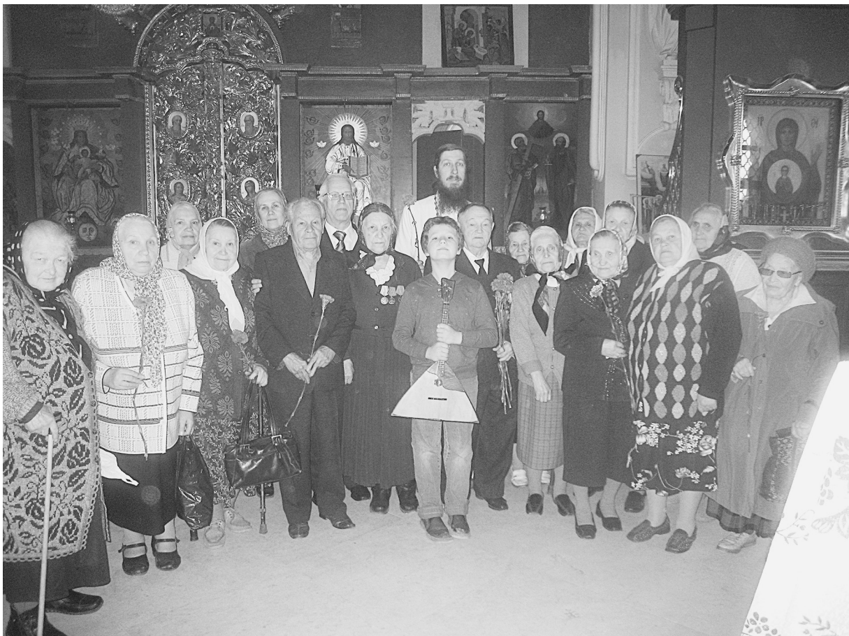
Ветераны нашего храма

Поздравляем всех прихожан нашего храма с 20-летием возобновления богослужений в Знаменском храме поселка Дубровицы!