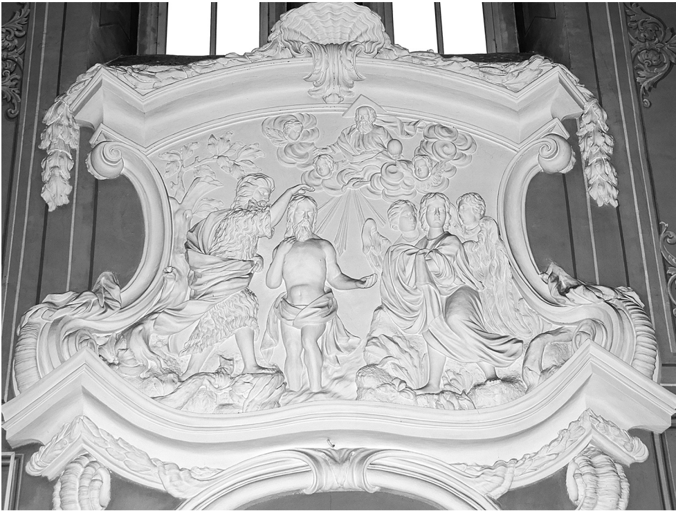
Крещение Господне. Богоявленский собор. Москва. Китай-город. Начало XVIII века.

гоявленском храме («Рождество Христово» и «Крещение Господне»). Кроме того, в обоих храмах одно из центральных мест занимает сцена, более распространенная в католической, чем в православной традиции, - «Коронование Пресвятой Богородицы». В нашем храме она расположена над алтарем в тре-