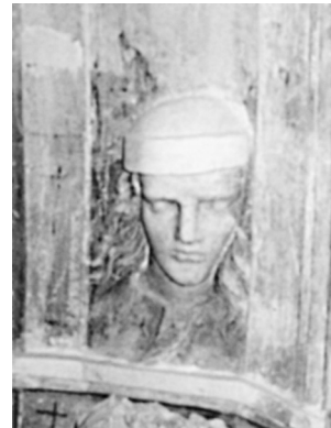
Скульптурное изображение итальянского мастера