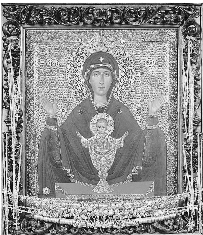
Икона Неупиваемая Чаша. Серпухов. XIX век

Развитием иконографии Знамения стали композиции таких икон, как Неупиваемая Чаша.