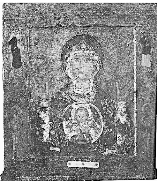
Икона Божией Матери «Знамение». Великий Новгород XII век

В византийском и древнерусском церковном искусстве был популярен образ Богородицы Оранты с Младенцем Христом. Причем Спаситель часто изображался в виде Эммануила (по-еврейски - «С нами Бог»), т.е. пребывающим во чреве Девы Марии. Пророчество об Эммануиле, как о грядущем родиться от Девы Спасителе мира, содержится в книге пророка Исаии (Ис. 7:14): «Итак, Сам Господь даст вам знамение : се, Дева во чреве примет и родит Сына, и нарекут имя Ему: Еммануил». И поэтому в русской традиции данный тип иконографии получил особое наименование — «Знамение». Знамение - это исполнение ветхозаветного пророчества о Рождении Спасителя мира. Изображение на иконе «Знамения» напоминает и о Благовещении архангела Гавриила Деве Марии, и о Рождестве Христовом. Дева уже приняла со смирением («Се, Раба Господня; да будет мне по слову твоему», Лк, 1:38) радостное благовестие архангела и Дух Святой сошел на Нее и тайна Боговоплощения начала совершаться и стала Она уже имущей во чреве Спасителя мира. Этот момент и запечатлен на иконе «Знамения». Знамение — это, в определённом смысле, образ Благовещения и предзнаменование Рождества и следующих за ним евангельских событий вплоть до Воскресения Христова. Название же иконы «Знамения» только в память чуда (знаме-