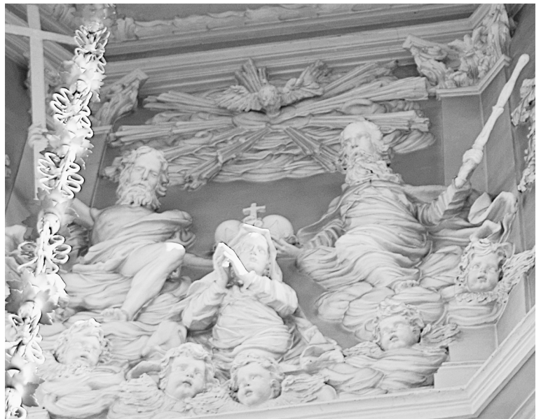
Коронование Богородицы. Знаменский храм. Дубровицы. Начало XVIII века.

Сочетание такой архитектуры со стукковыми композициями в световом четверике создало необычайно