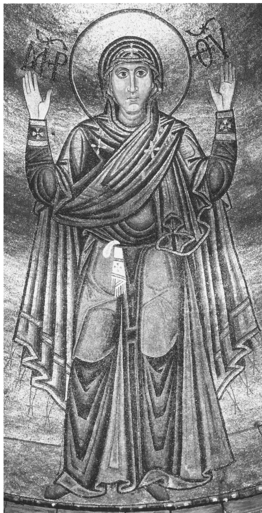
Оранта. Мозаика. Софийский собор. Киев. XI в.

Первые изображения Богородицы Оранты (чаще всего без Младенца) встречаются уже в римских катакомбах. Наиболее широкое распространение такие изображения Богородицы получают начиная с IX века в Византии. Так, в церкви Неа в Константинополе, сооруженной при Василии I в период с 867 по 886 г. было изображение Оранты в конхе апсиды. Верхний уровень росписей апсиды становится традиционным местом для мозаичного или фрескового изображения Богородицы Оранты. Например в апсиде Софийского собора в Киеве (XI в.) находится одно из известнейших мозаичных изображений Оранты (высота фигуры 5 м 45