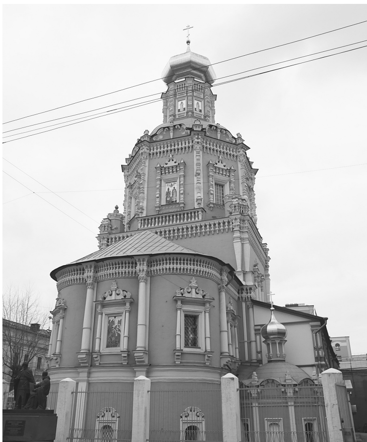
Богоявленский собор в Китай-городе. Современный вид

Во второй половине XIX века история монастыря была тесно связана с афонскими обителями. Из русского Пантелеимонова монастыря была привезена икона Божией Матери «Скоропослушница» и с ней другие святыни: частица мощей целителя Пантелеимона, крест с частицей Животворящего Древа, часть камня Гроба Господня. Для этих святынь выстроили Афонскую часовню.