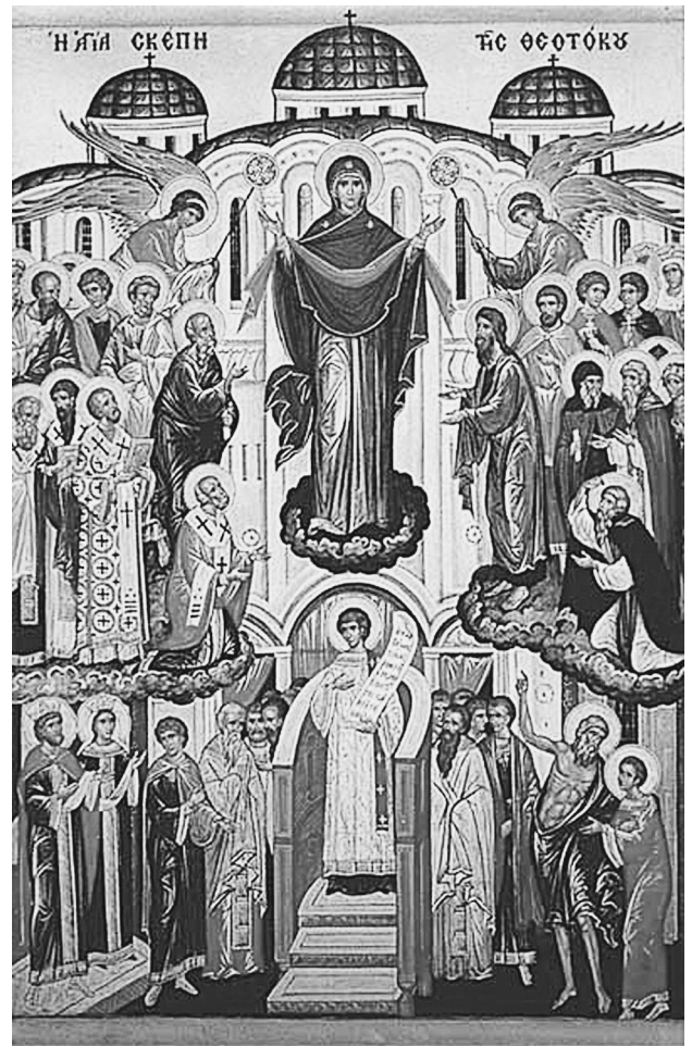
Икона Покров Пресвятой Богородицы