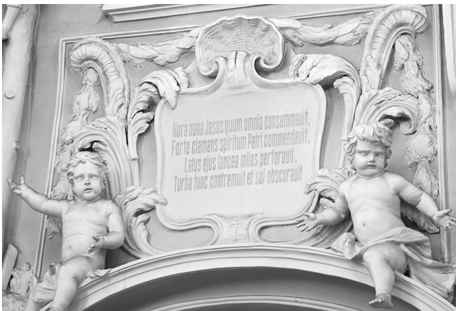
Раковина над картушем, лиственная гирлянда и ангелы. Знаменский храм. Дубровицы

типов - одна из основных деталей декораций - встречаются во всех трех памятниках. Регистры-ярусы дубровицкой лепнины в двух местах отделены друг от друга туго сплетенной гирляндой из лавровых листьев. В алтарной части Меншиковой башни в той же зоне протянута такая же гирлянда. При этом обращает на себя внимание не только сходство рисунка, но и тождество размеров. Наряду с лиственной гирляндой везде можно наблюдать гирлянду, сплетенную из плодов и цветов, набор которых везде повторяется: лимоны, гранаты, их ветви и листья, реже встречаются гроздья винограда. И во всех случаях совпадает рисунок плетения, s-образная линия ниспадения.