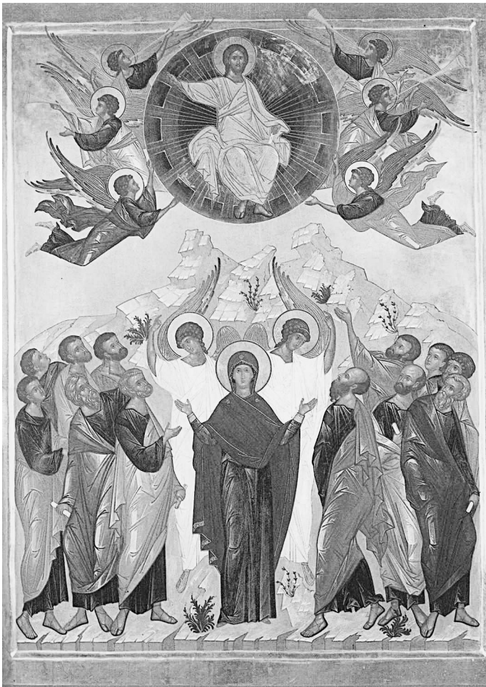
Икона Вознесения Господня

чрезвычайно редко. Этот образ входит в состав сложных композиций, например, в иконографии праздников Вознесения или Покрова.