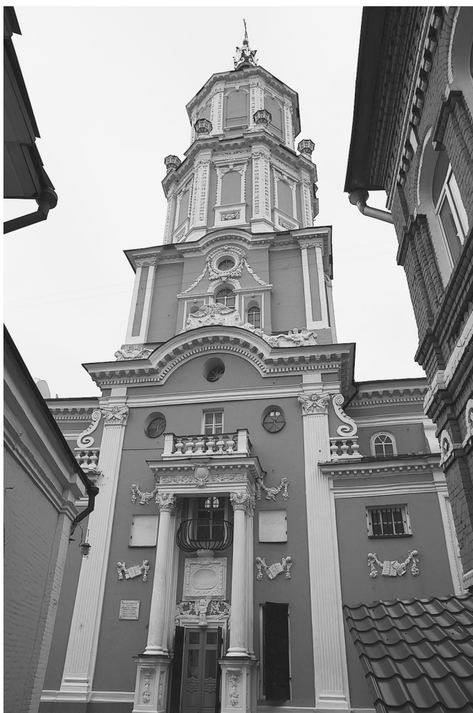
Современный вид Меншиковой башни

Богоявленская обитель издревле славилась своими иноками и настоятелями. Именно сюда ушел иночествовать старший брат преп. Сергия Радонежского Стефан, ставший потом первым игуменом Богоявленского монастыря. В нем же проходил послушание, а потом принял монашеский постриг боярский сын Елевферий Бяконт - будущий святитель Алексей Московский. Известно, что преп. Сергий