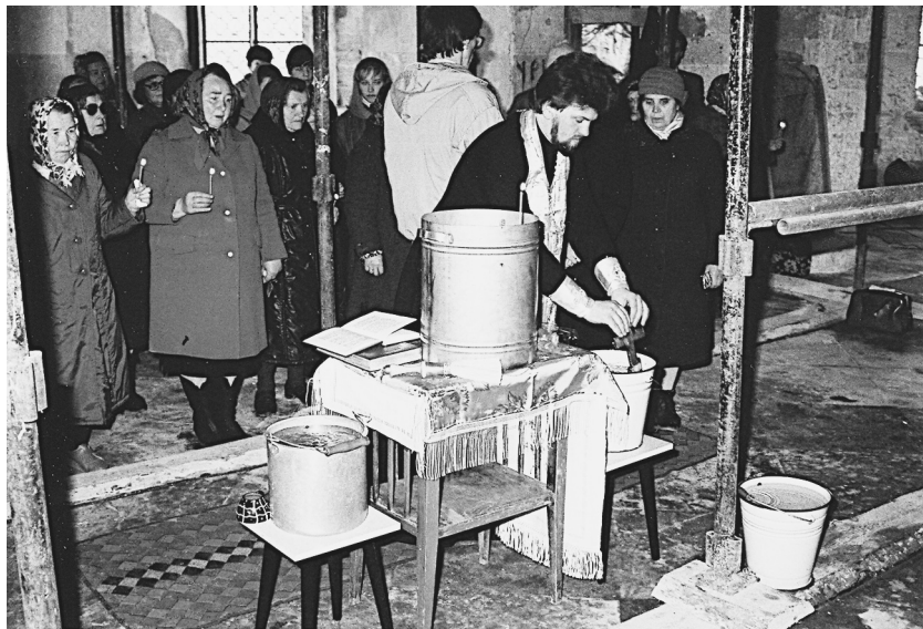
Один из первых молебнов в храме

Потом принесли еще несколько небольших аналойных икон в металлических окладах, но в очень плохом состоянии. Сначала они стояли в храме на подоконниках. Я тоже принесла из дома небольшие бумажные и картонные иконочки. Примерно через два месяца после первой службы в храм пришла моя сестра и удивилась, что у нас совсем нет икон, совсем пустой иконостас. Она тогда работала на электромеханическом заводе в гальваническом цехе, и взяла эти четыре иконы, опустила их в гальванические ванны, и они отмылись. Тогда эти иконы разместили в четыре проема справа и слева от Царских Врат. На том месте, где сейчас