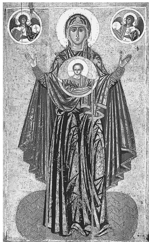
Оранта. Ярославль. 1218 г.