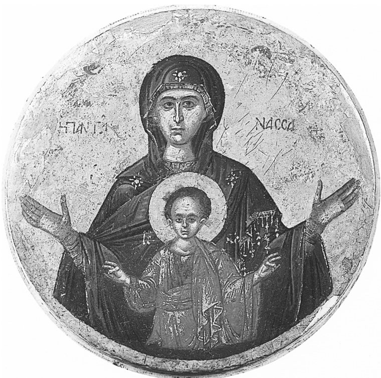
Икона Богоматери «Пантонасса». XV-XVI вв. Греция

На русских иконах в иконографии Знамения Богородица может изображаться в полный рост, как, к примеру, на Ярославской Оранте (Великой Панагии — от греч. Παναγία — Всесвятая) и Мирожской иконе, либо по пояс, как на Новгородской иконе «Знамение» и Курской Коренной иконе.