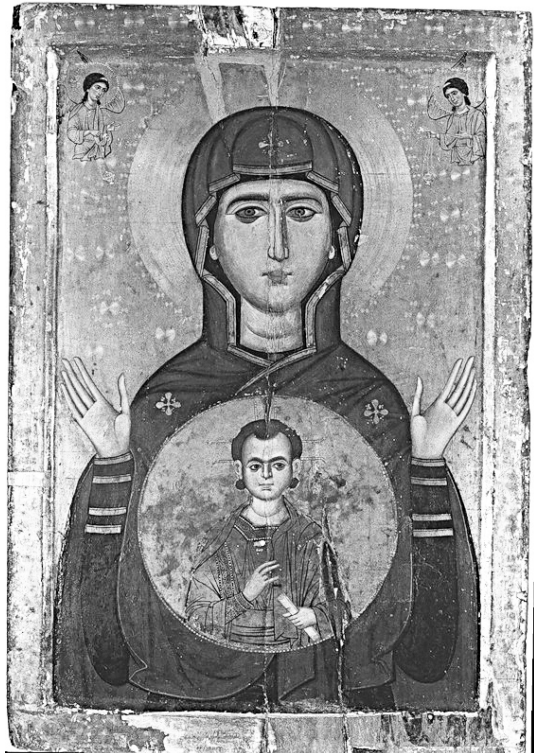
Икона Божией Матери «Влахернитисса». Сер. XIII в. Монастырь св. Екатерины. Синай

типа известны с VI века, но особенно популярны они стали в XII-XIII веках. Название «Знамение» чисто русское, а у греков они назывались по разному: Влахернитисса (из Влахернского храма Пресвятой Богородицы - места, где было видение Покрова Пресвятой Богородицы блж. Андреем), Платитера («Πλανυτέρα τὸν οὐρανόν» – «Ширшая небес», из литургии Василия Великого), Пантонасса (παντο – все + νάσσα от ναίω – жить, обитать; находиться; населять).