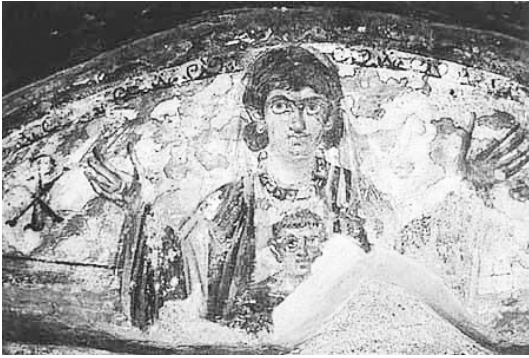
Оранта с Младенцем. Катакомбы Святой Агнии в Риме. Начало IV века

Икона Божией Матери, именуемая «Знамение», изображает Пресвятую Богородицу, сидящую или стоящую и молитвенно поднимающую руки Свои; на груди ее, на фоне круглого щита (или сферы) - благословляющий Божественный Младенец - Спас-Эммануил. Такое изображение Богоматери относится к числу самых первых Ее иконописных образов и еще называется Оранта, что означает «молящаяся».