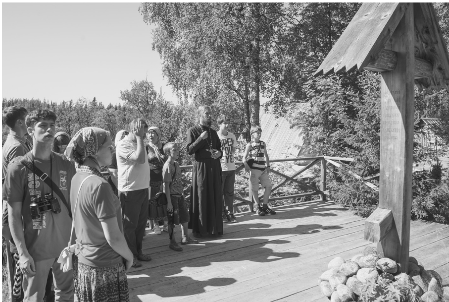
У подножия горы Голгофы

ных захоронений, открытых только после 2000-го года. На месте обретения святых мощей Петра Зверева - часовня, а сами мощи - в Воронеже. По благословию Патриарха на Соловках в монастыре оставлена честная глава священномучени-