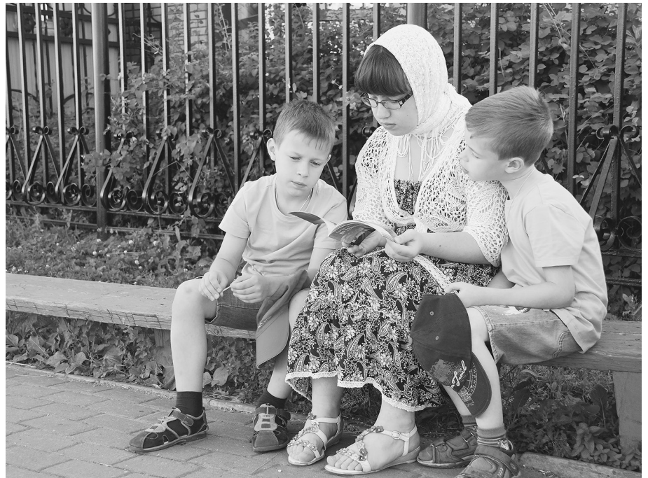
В Дивеево с братьями

После Дивеево мы поехали в Полоцк, к бабушке и дедушке. Они живут в пригороде, в небольшом уютном городке. Я любила брать с собой книгу и идти на прогулку. На одной из таких прогулок я познакомилась с одной девочкой. Она оказалась интересным