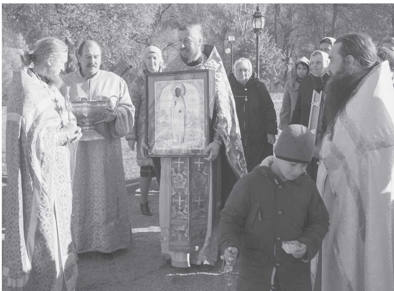
Крестный ход в день празднования 700-летия прп. Сергия Радонежского