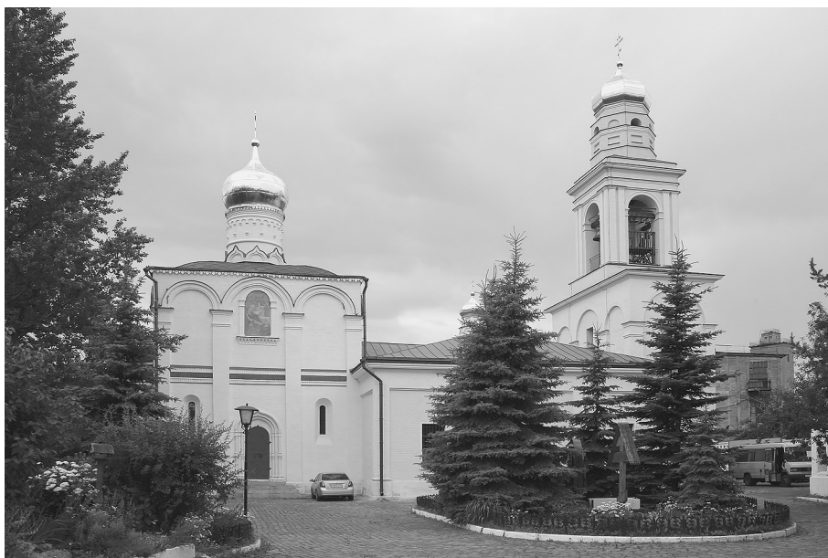
Храм Рождества Богородицы в Старом Симонове

Я хочу рассказать об одном замечательном московском храме, который связан с именем святого Сергия Радонежского и с историей Руси.