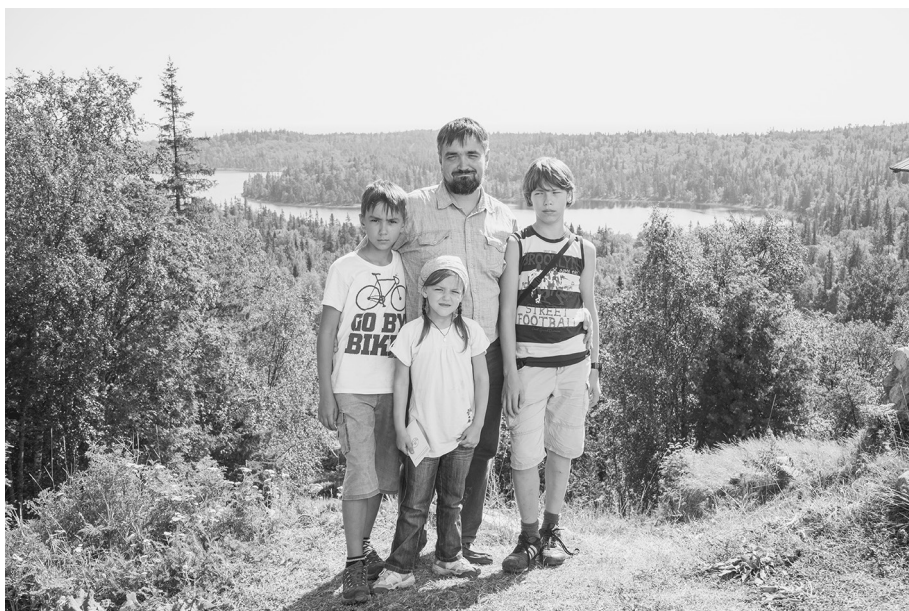
На горе Голгофа

еще очень скромно и бедно. А вот красивые бело-голубые иконочки нашей такой родной Знаменской Божией Матери, потому что здесь она тоже почитается, здесь придел в ее честь.