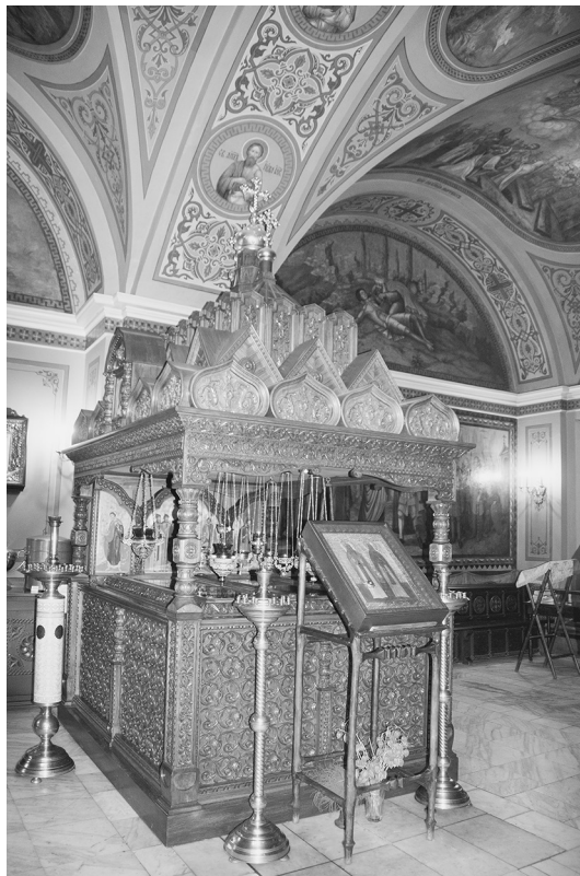
Рака с мощами святых схимонахов Александра Пересвета и Андрея Ослябя

Спустя ровно 10 лет после освящения храма преподобным Сергием в день празднования Рождества Пресвятой Богородицы произошла Куликовская битва или Мамаево побоище, как говорили русские люди. И, я думаю, все русские люди знают, что Московского князя Димитрия, прозванного после битвы Донским, благословил преподобный Сергей и отправил с войском схимонахов Пересвета и Ослябю. Они укрепили дух русского войска и решимость победить. Много раз с восхищением рассматривал я картины русских ху-