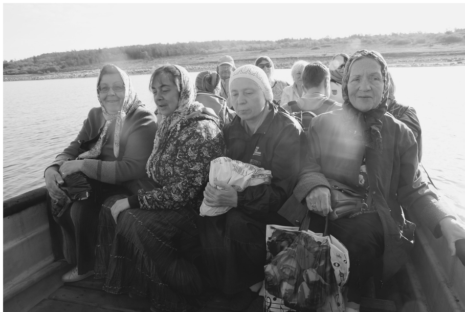
По морю на остров Анзер

Ну, а для нас главной целью была гора Голгофа -