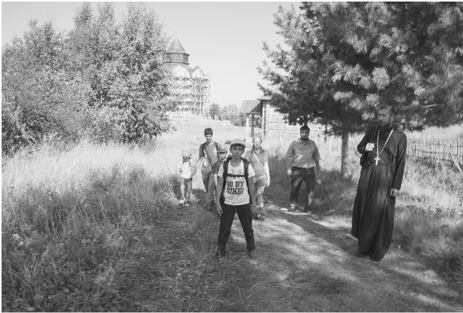
В Троицком Анзерском скиту

это высочайшая точка всего Соловецкого архипелага островов.