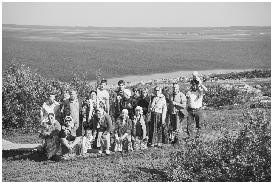
Соловецкие просторы. На Большом Заяцком острове в последний день

вает, когда приближаемся к святыне, т.е. к Свету. Ведь можно казаться ворчливым, но быть в трудную минуту добрым и чутким к другим. Можно казаться благочестивым, но быть равнодушным и нетерпимым к чужим слабостям и недостаткам. Можно казаться смиренным и добродушным, но оказаться самолюбивым и эгоистичным. На Соловках нельзя казаться, там можно только