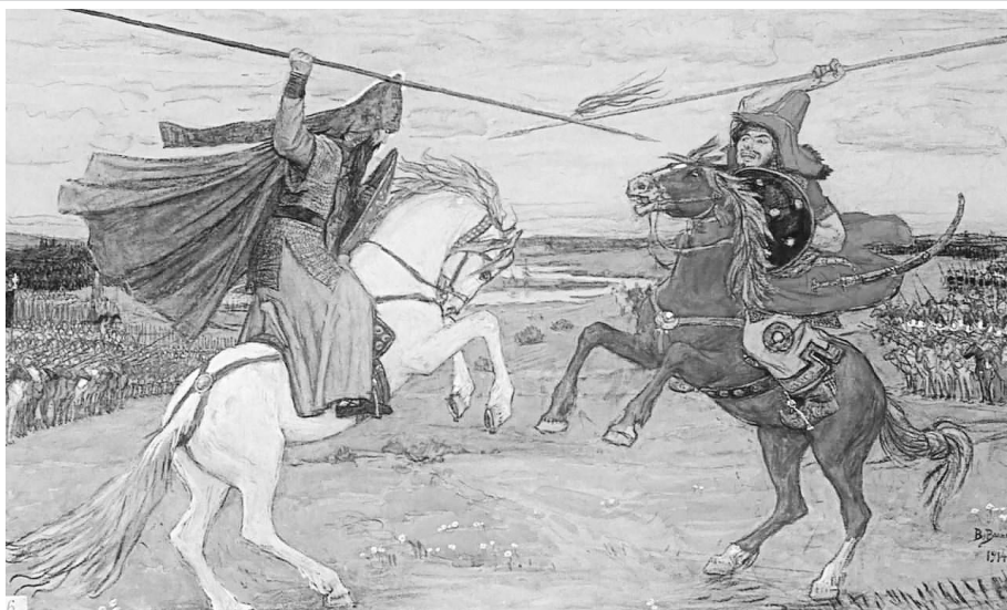
В.М.Васнецов. «Единоборство Пересвета с Челубеем».

В заключении хочу поделиться, чем же дорог этот храм мне. Мама рассказала о том, что храм Рождества Богородицы вернули Русской Православной Церкви в 1989 году. Это был первый в Москве, а может быть и в стране, возвращенный храм. По всей Москве началось возвращение храмов, монастырей, но они были разрушены, осквернены. Например, в храме Рождества Богородицы завод «Динамо» разместил масляные компрессоры. Тогда многие москвичи, особенно молодежь, откликнулись и стали помогать восстанавливать храмы. С этого начался путь и моих родителей в Церковь. Друзья привели папу, тогда еще студента, в храм Рождества