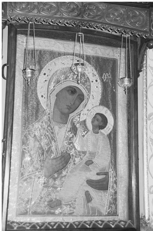
Тихвинская икона из СтароСимоновского храма

дожников, на которых изображен поединок Пересвета с Челубеем, с которого началась битва. В «Сказании о Мамаевом побоище» татарский богатырь сравнивается с древним Голиафом,