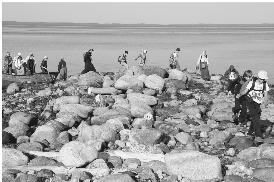
Высадка на Анзере

Едва мы ступили на каменистый берег, как почувствовали, что все здесь сохранилось почти в таком же виде, как в те далекие времена, когда в этих местах появились первые право-