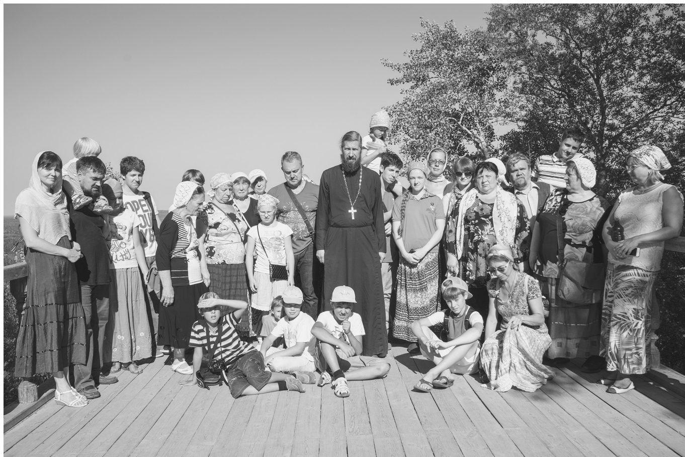
На Секирной горе

А вот велосипеды нам пригодились, чтобы поехать по Большому острову, например, на Великое озеро на рыбалку или на Банное озеро искупаться. Самая дальняя велосипедная поездка была в Филиппову (Иисусову) пустынь. Она находится в 2 км от монастыря на восток по дороге на Муксалму. Это место избрал святитель Филипп для уединенной молитвы, когда стал