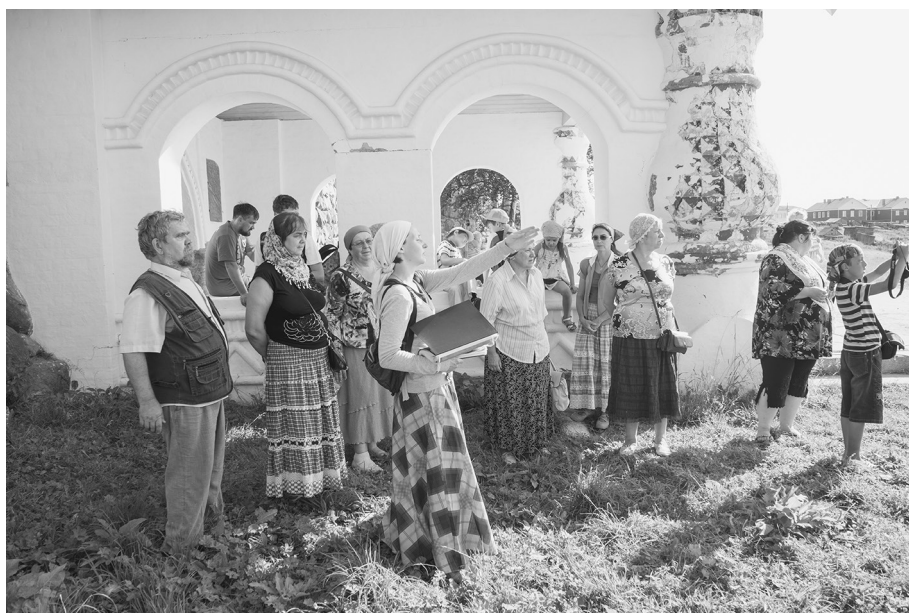
На обзорной экскурсии по монастырю

Да, сначала мы были все-таки туристы. Едва разместились по квартирам, надо было бежать на обзорную экскурсию. Три часа нам рассказывали историю монастыря, показывали храмы и всякие удивительные места. Например, сушило для сушки зерна, где задолго до нашего времени применялась технология тепло-го пола; остатки мельницы, которая еще крутится под напором падающей воды. А дети, конечно, побежали к пушкам и бойницам, представив себя защитниками монастыря, осаждаемого английскими судами во время Крымской войны.