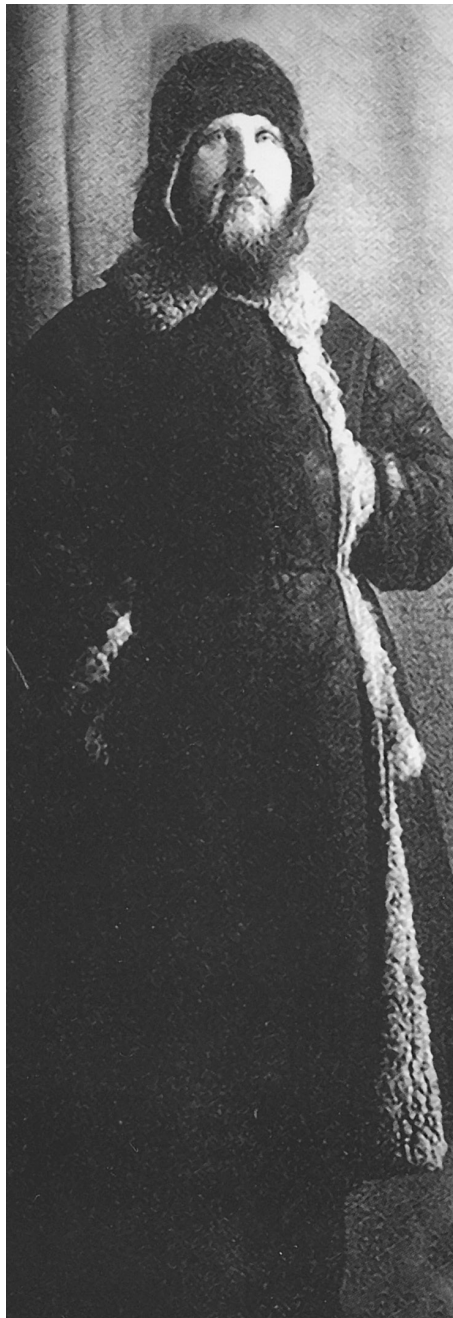
Владыка Иларион в заключении на Соловках

ли видеть реальное воплощение духовной силы Церкви, ее несокрушимой твердыни, и самым подходящим объектом для этого воплоще-