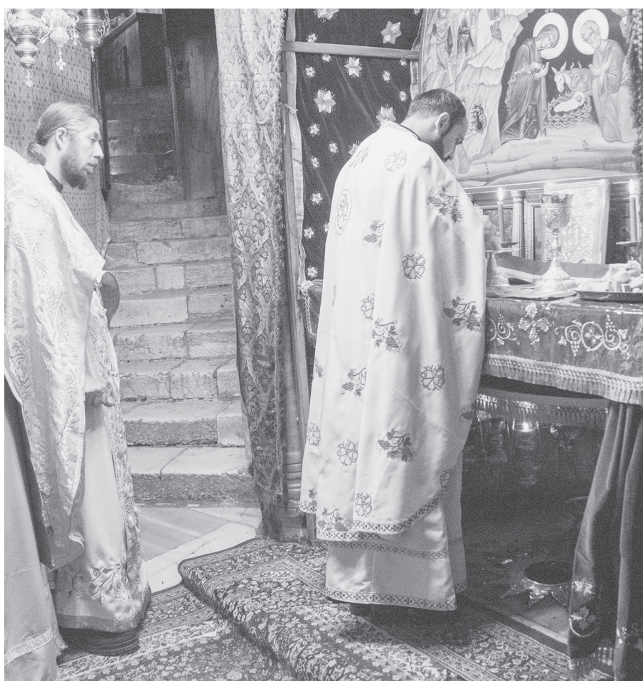
Литургия в пещере Рождества Христова в Вифлееме

Христос рождается — славьте! Христос (грядет) с небес — встречайте!