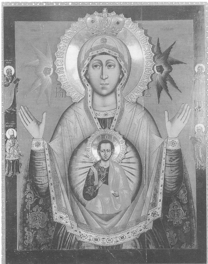
Царскосельская икона Божией Матери

Еще одной из самых почитаемых икон «Знамение» стал Царскосельский образ Пресвятой Богородицы. Он был подарен второму царю из рода Романовых Алексею Михайловичу Константинопольским патриархом Афанасием в 1653 г. Она была келейной иконой царской семьи около ста лет. В середине XVIII века дочь императора Петра I Елизавета Петровна перенесла икону в Знаменскую церковь Царского Села рядом с Петербургом. Замечательно, что, сделавшись императрицей, Елизавета I издала манифест о своем восшествии на престол 10 декабря в день празднования иконы Божией Матери Знамение. Икону поместили в верхнем ряду иконостаса Знаменской церк-