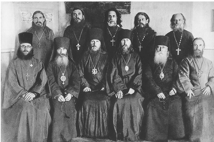
Архиепископ Иларион (3-й слева в первом ряду) с группой заключенных священнослужителей СЛОНа

Многотрудный и скорбный путь Владыки завершился 15/28 декабря 1929 года. Священномученику было 43 года. Занимавший