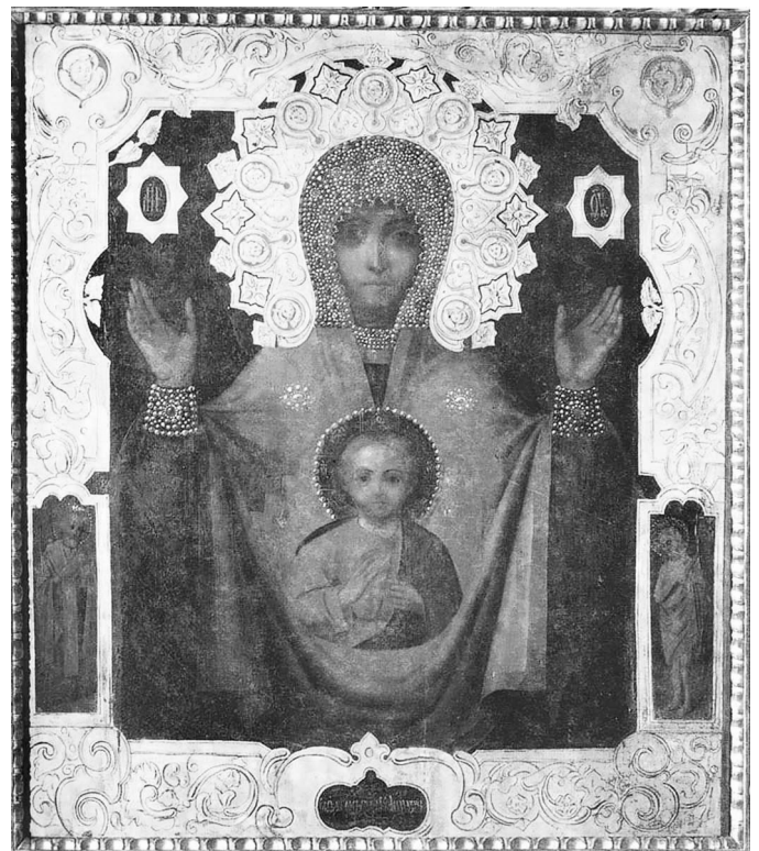
Абалацкая икона Божией Матерью

момент, когда особенно надо усилить наши молитвы к Богородице перед ее образом Знамение, прося ее милости и помощи в трудное время для нашей Родины.