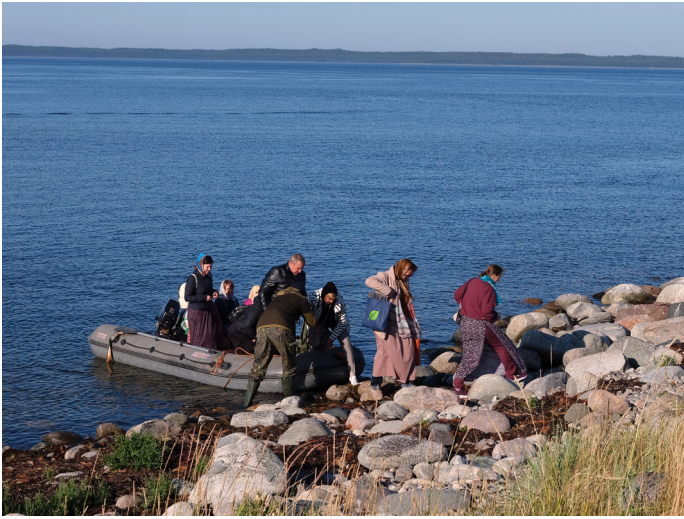
Высадка Дубровицких паломников на остров Анзер

Заветная мечта, а может быть, и обет, почти каждого паломника на Соловецкие острова - добраться до острова Анзер и подняться там на вторую в мире Голгофу.