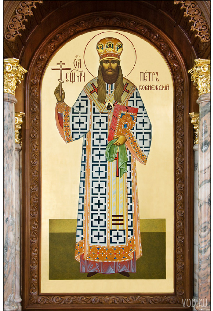
Икона над мощами сщмч. Петра в Благовещенском соборе Воронежа

наступившей ночной тишине послышалось тихое церковной пение: совершался чин погребения усопших...», - рассказывали участники того события.