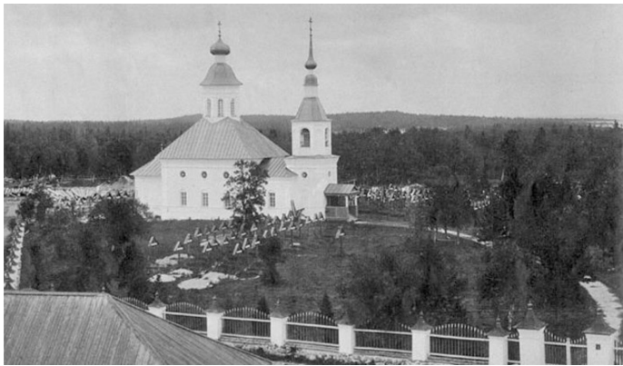
Церковь прп. Онуфрия Соловецкого монастыря. Фото начала XX века. Не сохранилась.

Первое время ссыльным священнослужителям разрешалось посещать кладбищенскую церковь во имя прп. Онуфрия за пределами монастыря. При закрытии монастыря шестьдесят монахов согласились остаться вольнонаёмными, для них оставили действующей церковь на кладбище. Ежедневно там совершались службы: с шести часов вечера всенощная и в четыре утра - литургия. Архиепископ Петр старался бывать на всех службах, на всенощной всегда читал шестопсалмие. Он обладал очень сильным голосом и прекрасной дикцией, каждое его слово ясно разносилось по храму. «Одна у нас радость и утешение - это церковь, где находим абсолютный душевный покой, забываются все жизненные невзгоды далекого севера. В церковь имеем возможность ходить почти