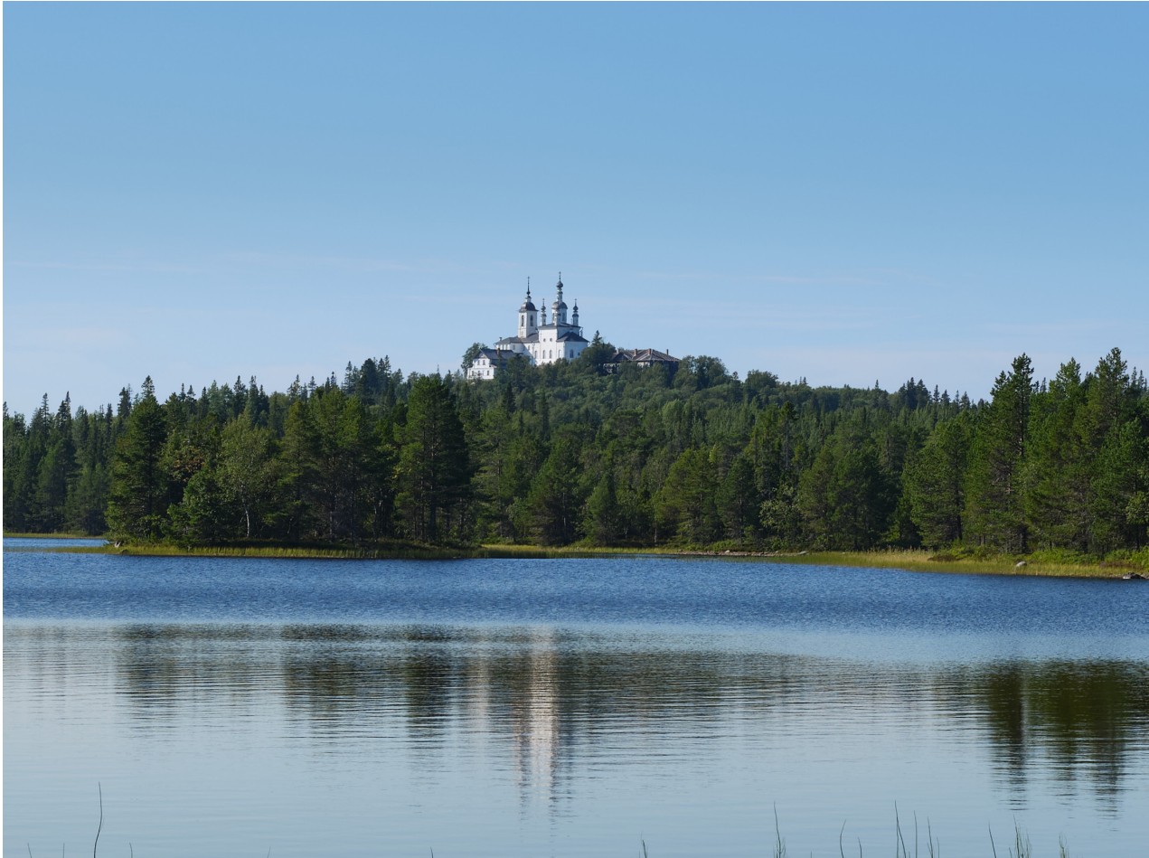
Голгофо-Распятский скит со стороны Голгофского озера

квасом или сухарями, размоченными в тёплой воде. Даже в великие праздники употребляли «едину капусту вареную или грибы zde растущие, толокно или горох, и ягоды, и сим постным ядением довольны были». Обращаясь к насельникам Голгофо-Распятского скита, архимандрит Досифей писал: