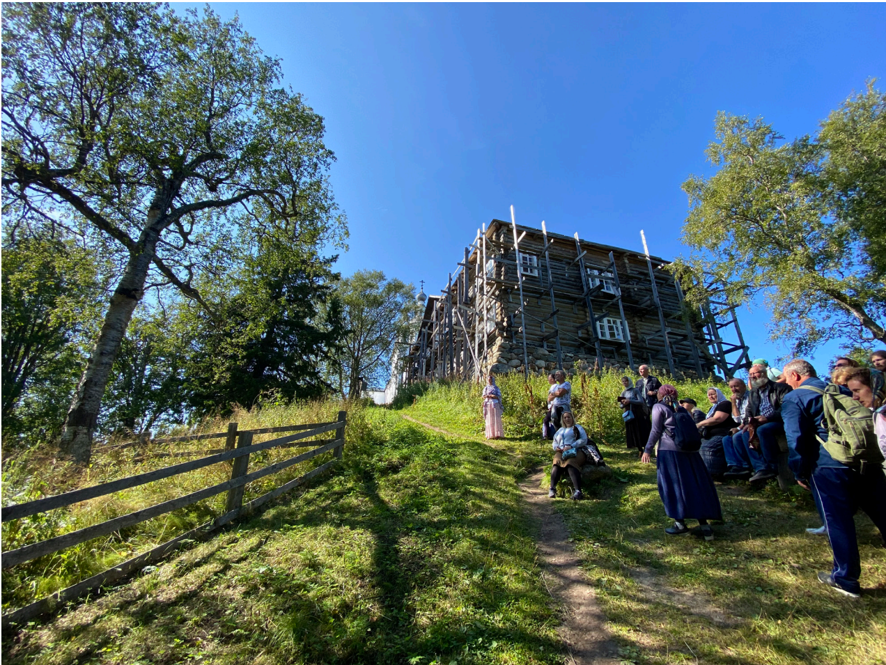
Паломники из Дубровиц на горе Голгофа возле удивительной березы, выросшей в виде креста во времена, когда все кресты на Анзере были порушены безбожной властью

Здесь содержались сотни православных священнослужителей, среди которых были и церковные иерархи - новомученики архиепископ Серафим (Самойлович), епископ Дамаскин (Цедрик), архиепископ Петр (Зверев).