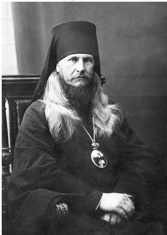
Священномученик Петр (Зверев)

Сбылось предсказание Божие Матери прп. Иову о том, что «придёт время - верующие на этой горе будут падать от страданий как мухи». Но не пали духом наши праотцы, не прервалась история святости на Русской земле, а символом, вечной памятью и источником нашего укрепления стала Русская