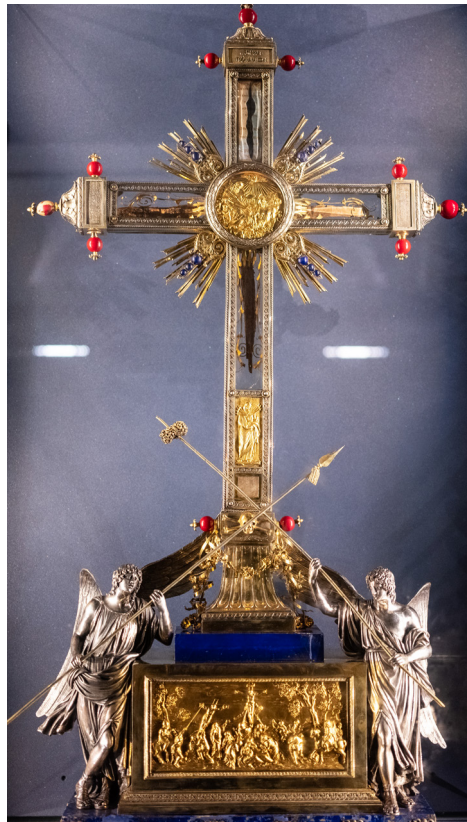
Частица Древа Креста Господня из базилике Санта-Кроче-ин-Джерусалемме в Риме

сейчас можно встретить во многих храмах и монастырях мира. Исследователь конца XIX века Шарль Роо де Флери в сочинении «Память об орудиях страстей Христовых» сообщает, что суммарный вес всех документально зафиксированных фрагментов Креста составляет всего около трети объема от Креста. Самая большая из известных частиц Животворящего Креста Господня находится в Иерусалиме в Храме Гроба Господня.