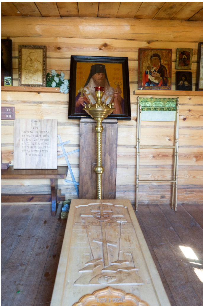
Место могилы сщмч. Петра в часовне.