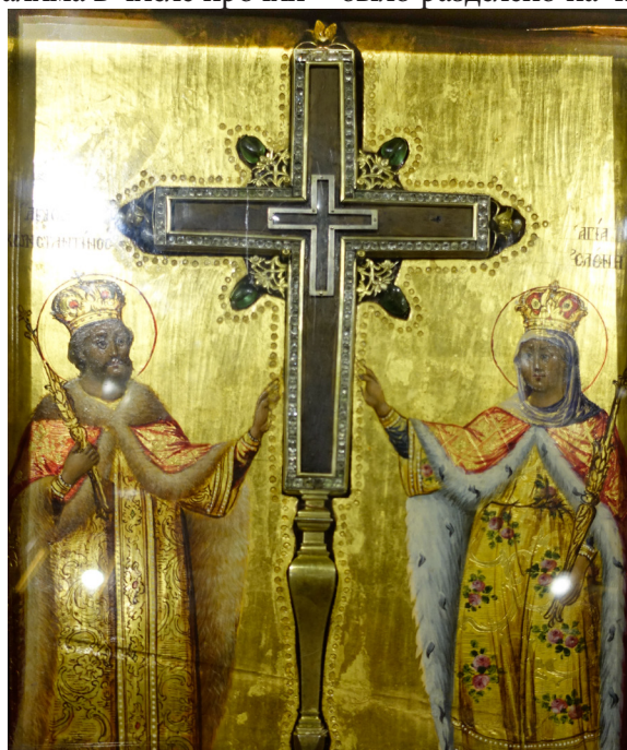
Частица Древа Креста Господня из Храма Гроба Господня в Иерусалиме