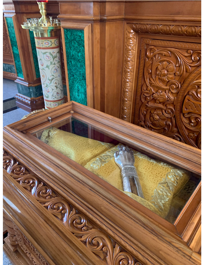
Рака с мощами сщмч. Петра (Зверева) в Благовещенском кафедральном соборе Воронежа.