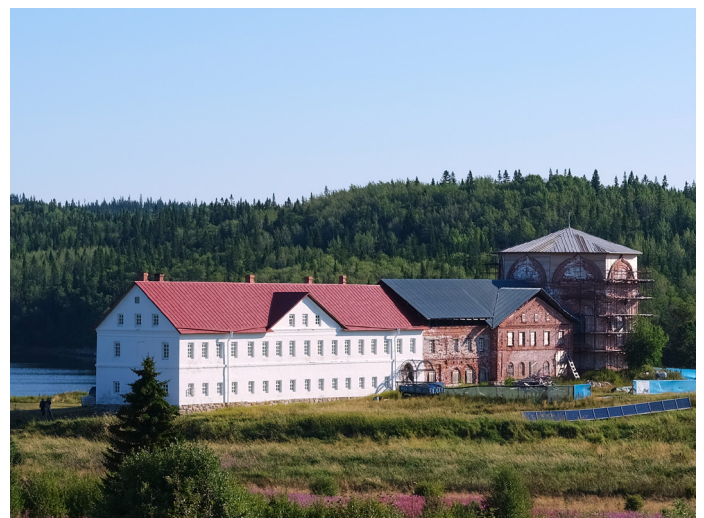
Троицкий скит, основанный преп. Елеазаром. Современный вид

Этот эпизод из жития преподобного Елеазара не просто вспомнился, а невольно воочию представился, когда судно с дубровицкими паломниками отплыло от Варваринского причала и в течение полутора часов добиралось до Анзера. Но мы шли по спокойному морю под летним ласковым на севере солнцем. И только, когда вышли в открытое море, пришлось потерпеть холодный ветер. Но разве сравнить это с тем, какие