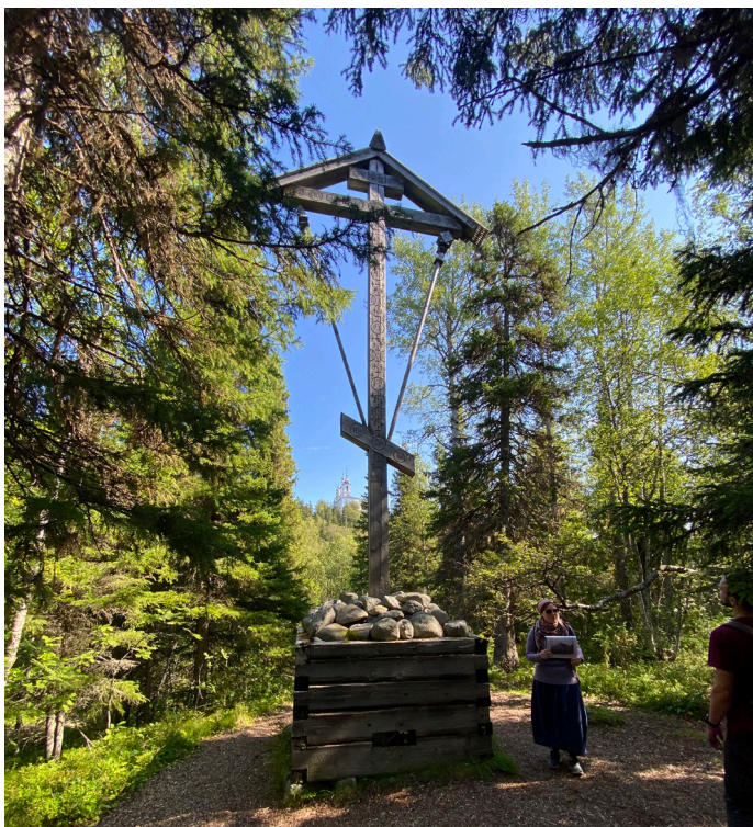
Поклонный крест возле Голгофо-Распятского Скита

Во времена Соловецкого лагеря в часовне размещался пикет охранников, затем она была заброшена, и местонахождение ее забыто. А в 1995 году место Елеазаровой пустыни было вновь открыто отрядом Морской арктической экспедиции, производились раскопки и нашли только фундамент, первый венец сруба и дверь. Благодарение Богу - мы теперь можем отдохнуть и помолиться в этом святом месте - часовня восстановлена.