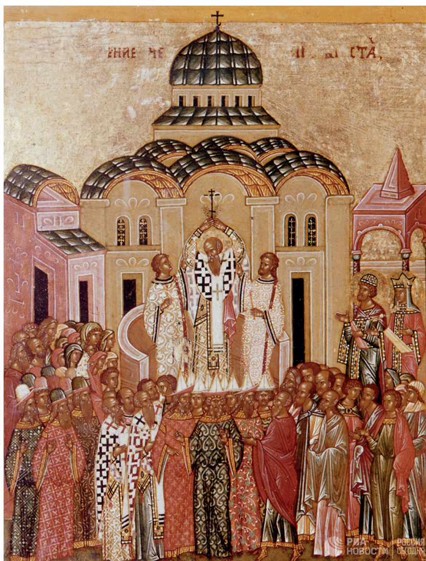
Икона праздника Воздвижения Честного и Животворящего Креста Господня

СПАСИ ГОСПОДИ ЛЮДИ ТВОЯ И БЛАГОСЛОВИ ДОСТОЯНИЕ ТВОЕ