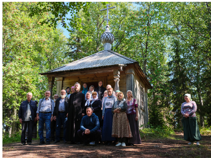
Часовня прп. Елеазара

Что стало со святыми мощами прп. Елеазара, до сих пор точно неизвестно. Есть свидетельства о том, что в 1925 году рака в Троицком храме была разорена, мощи увезены, предположительно в Петербург. Святые мощи Соловецких угодников вернулись в монастырь, а преподобного