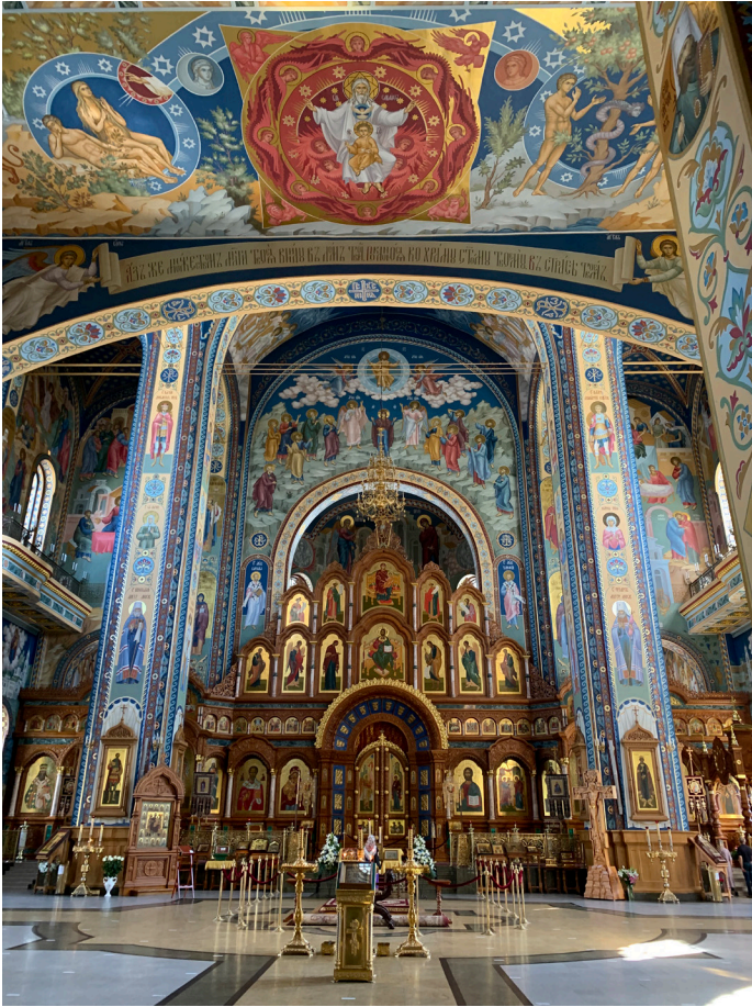
Внутренний вид Благовещенского собора Воронежа. Возле правого столпа мощи свт. Митрофана Воронежского, возле левого столпа мощи сщмч. Петра (Зверева).