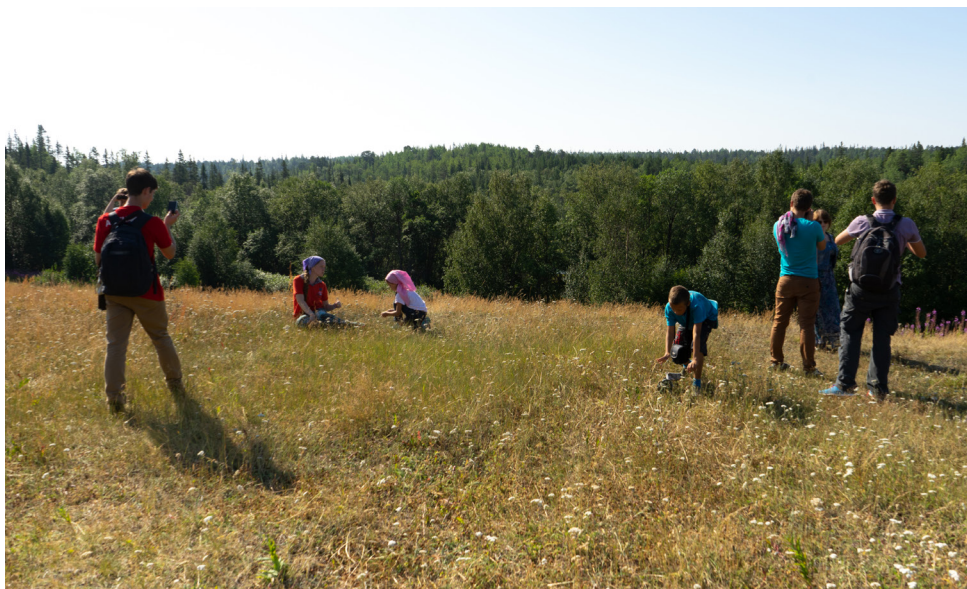
Богородичный луг. 2014 г.

Елеазарова озера паломники поднимаются сквозь густой хвойный лес туда, где подвизался прп. Елеазар до основания им Троицкого скита. Подвижник вырезал и поставил деревянный крест, устроил рядом крошечную келию и прожил здесь в безмолвии четыре года. Жизнь подвижника протекала в трудах, лишениях и молитвах ко Господу. Высокий холм покрыт соснами, опоясан внизу густыми зарослями и буреломами. С трёх сторон подступы к нему прикрыты озерами, а с четвёртой - болотом. Лес изобилует не только грибами и ягодами, но и дикими зверями.