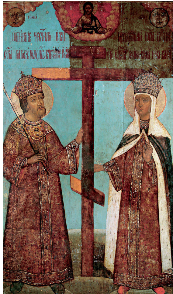
Равноапостольные царь Константин и царица Елена

2-я версия предания, возникающая в конце IV - начале V века, сообщает, что святая Елена пыталась узнать место пребывания Креста у иерусалимских иудеев, и в