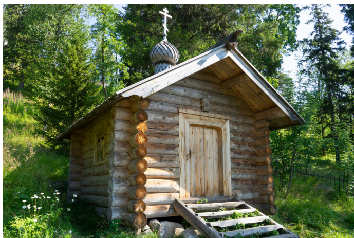
Часовня над могилой сщмч. Петра (Зверева) у подножия горы Голгофы на Анзере.

Вот что вспоминал один из служащих этого тифозного госпиталя: «Картина, которую я застал по приезде, была ужасна, название Голгофы вполне оправдалось. В тесных помещениях, битком набитых людьми, стоял такой спертый воздух, что само пребывание в нем продолжительное время казалось смертельным. Большая часть людей, несмотря на мороз, была совершенно раздета... на остальных - жалкие лохмотья. Истощенные люди, лишённые подкожного жирового слоя, скелеты, обтянутые кожей, голыми выбежали, шатаясь, из часовни к проруби, чтобы зачерпнуть воды в банку из-под консервов. Были случаи, когда наклонившись, они умирали...».